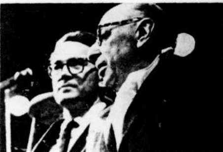
Igor Stravinsky et Robert Craft

Cette fois, il ne s'agit pas d'une composition « sensationnelle » du maître. Mavra date de 1921-1922. Sa première représentation eut lieu à Paris en 1923. L'opéra fut violemment attaqué par la critique parce qu'on n'y trouvait aucune ressemblance avec quelque ouvrage précédent et qu'il semblait être