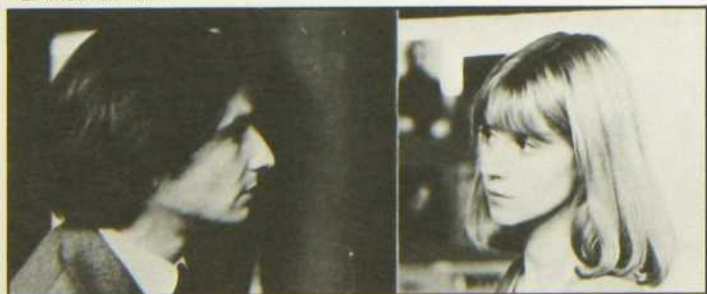
« L'Amour en fuite »