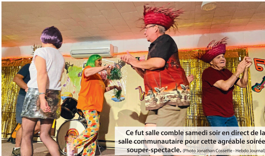
Ce fut salle comble samedi soir en direct de la salle communautaire pour cette agréable soirée souper-spectacle.