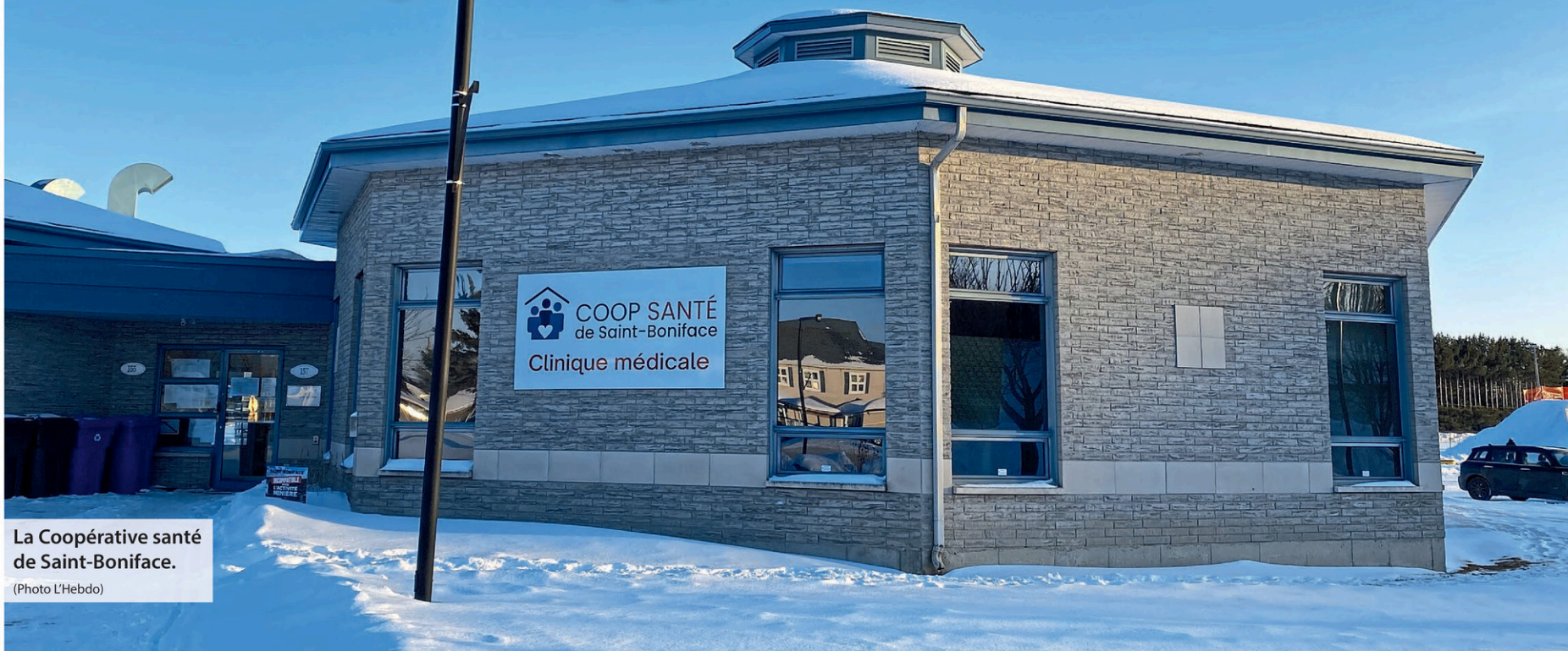
La Coopérative santé de Saint-Boniface.