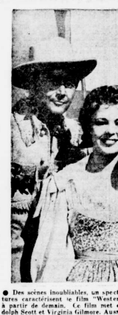
Des scènes inoubliables, un spectacle rempli d'émotions et d'aventures caractérisent le film "Western Union", à l'affiche du Premier à partir de demain. Ce film met en vedette Robert Young, Randolph Scott et Virginia Gilmore. Aussi à l'affiche, Victor McLaglen, Edmond O'Brien et June Havoc, dans "Powder Town".