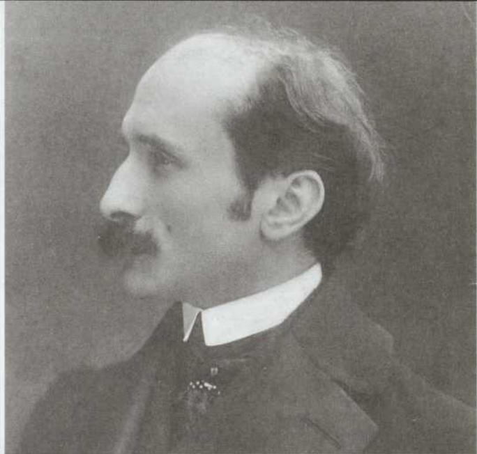
Portrait d'Edmond Rostand.