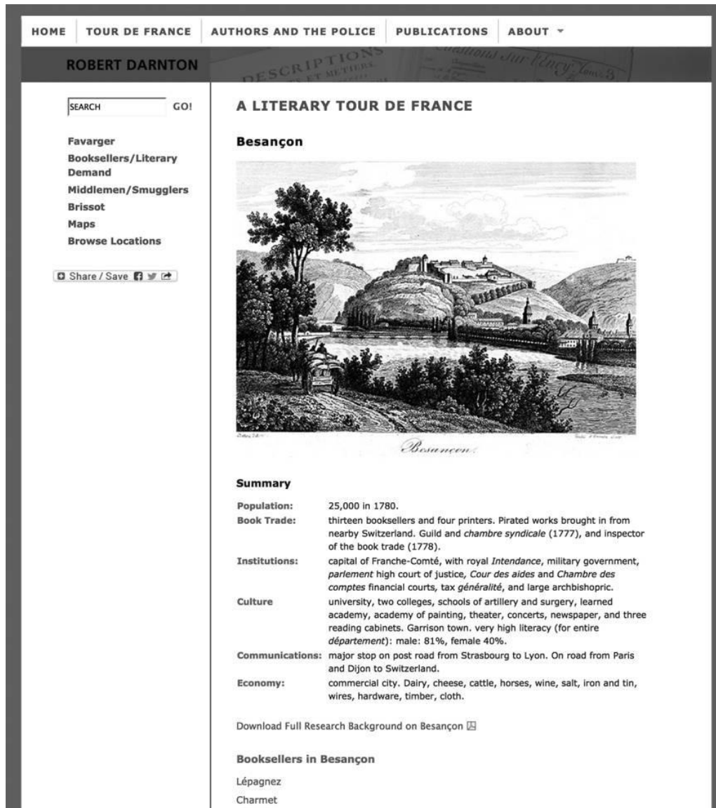
Figure 3. Page Web relative à Besançon (version couleur accessible en ligne).

Une liste de livres à succès permet de savoir lesquels sont le plus en demande à la fois chez les libraires et chez leurs lecteurs, puisque, comme je l'expliquais, l'offre et la demande se correspondent à peu de choses près dans le cas des 18 libraires retenus. Le site Web présente deux de ces listes. La première contient les titres publiés par la STN seule, et par la STN en collaboration avec la Société typographique de Lausanne ou la Société typographique de Berne. Ces titres pèsent plus lourd dans les statistiques que ceux provenant de l'inventaire général de la STN, constitué à partir d'échanges. La demande prime lorsque la STN et ses alliés décident de procéder à la réimpression d'un livre, ce pourquoi la première liste figure