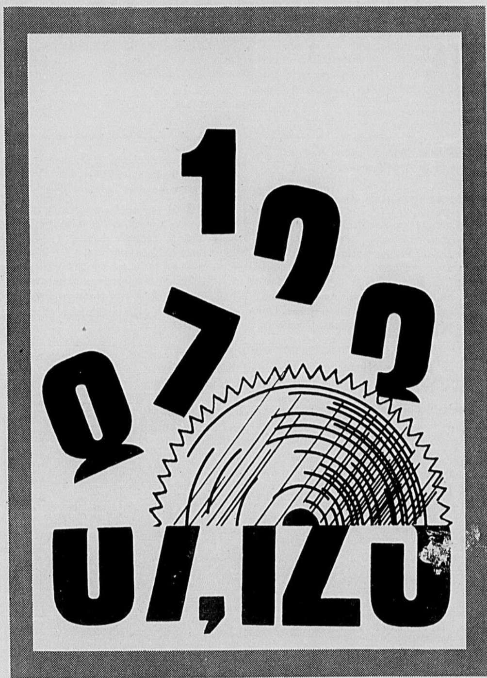
Cette annonce est publiée gracieusement à l'occasion du MOIS DE LA PUBLICITÉ

Règle générale, la publicité offre à tous, les produits de l'industrie. Il fut un temps où le petit artisan ne fabriquait que pour les acheteurs de son entourage immédiat : son village ou le quartier de la ville où il exerçait. Avec l'avènement de la grande industrie, la publicité a élargi les horizons du commerce, mettant à la portée des producteurs des marchés régionaux, nationaux et internationaux. En agrandissant les marchés la publicité favorise la grande production ce qui réduit les frais et permet, à cause de la concurrence, de réduire les prix de détail.