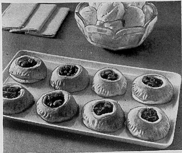
● BRIOCHES AUX CERISES ET AUX NOIX — Ces délicieuses friandises tiennent à la fois de la brioche et de la tartelette. Les brioches aux cerises et aux noix se composent, en effet, d'une pâte à base de levure, façonnée comme de petites tartes, que l'on remplit d'une succulente garniture de cerises et de noix.

Réjouissez-vous sans cesse dans le Seigneur, je le dis encore, réjouissez-vous. Que votre bienveillance soit connue de tous les hommes. Le Seigneur est proche. (Phil 4, 4-6)