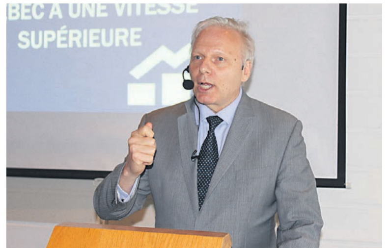
Jean-François Lisée était à Sept-Îles, vendredi.

Sensibilisé par le Collectif Sept-Îles Agir-Avenir, qui réclame la création d'un fonds d'urgence de 25 millions $ pour aider la PME à traverser le ralentissement du fer, Jean-François Lisée a d'abord salué l'initiative citoyenne avant de se dire «très ouvert à adapter des solutions aux situations locales». Le collectif voudrait notamment que Québec devance certains travaux d'infrastructures publiques. «On peut décider que pendant des cycles baissiers de ressources naturelles, il y ait davantage de soutien à des régions comme la Côte-Nord (...) Il y a cette suggestion de quand il y a un ralentissement, de faire exprès pour accélérer les investissements publics. Bien oui! On n'est pas obligé de le faire pour toutes les régions, mais on peut adapter l'action du gouvernement», a-t-il