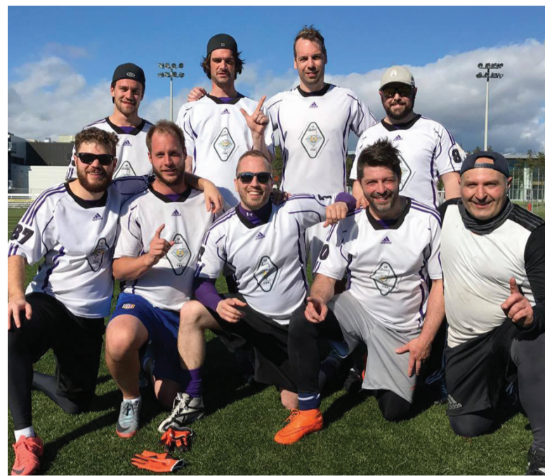
Les grands champions chez les hommes, ceux de la classe A, les Lefties.