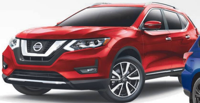
Rogue SL illustré*