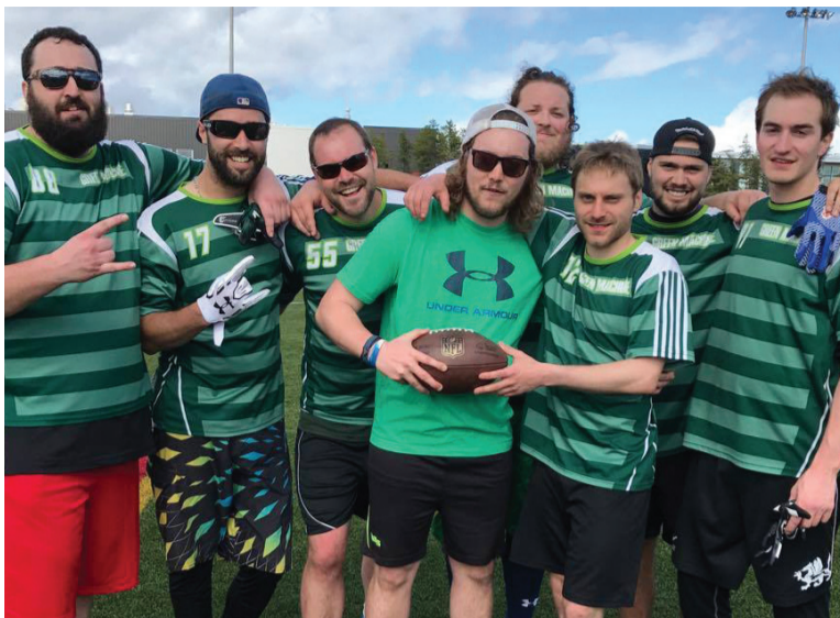
St-Pierre et compagnie, la formation gagnante du B chez les hommes.

Un rendez-vous qui a couronné trois équipes dimanche. Chez la gent féminine, Touch me a eu le meilleur en finale sur Bleu's Back. Du côté des hommes, Lefties