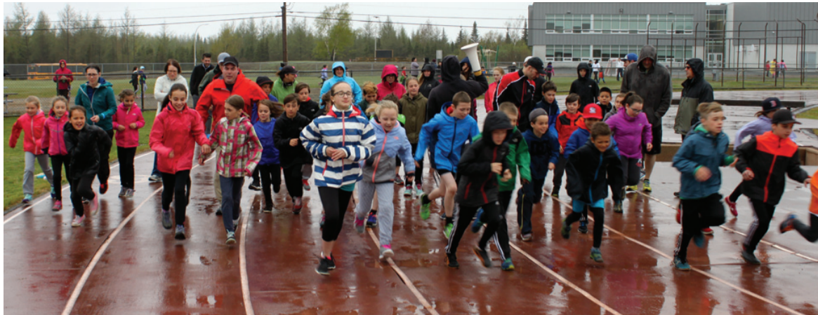
C'est un départ pour un groupe d'élèves et quelques parents pour plusieurs tours en 30 minutes.