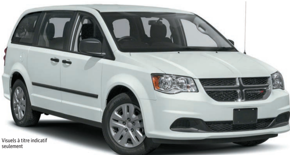
Visuels à titre indicatif seulement

ET NOUS INCLUONS MAINTENANT LA GRAND CARAVAN À CETTE OFFRE