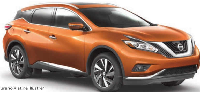
Murano Platine illustré*

3 e BANQUETTE POUR ACCUEILLIR 7 PASSAGERS