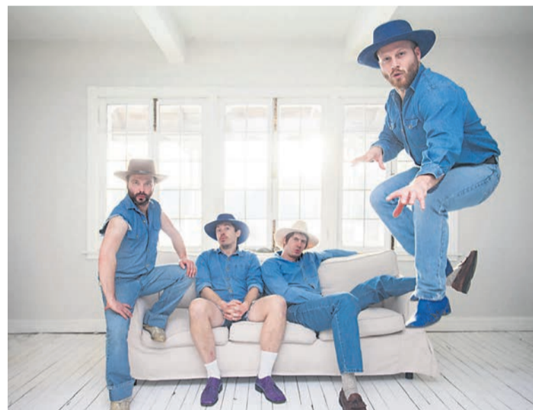
Bleu Jean Bleu