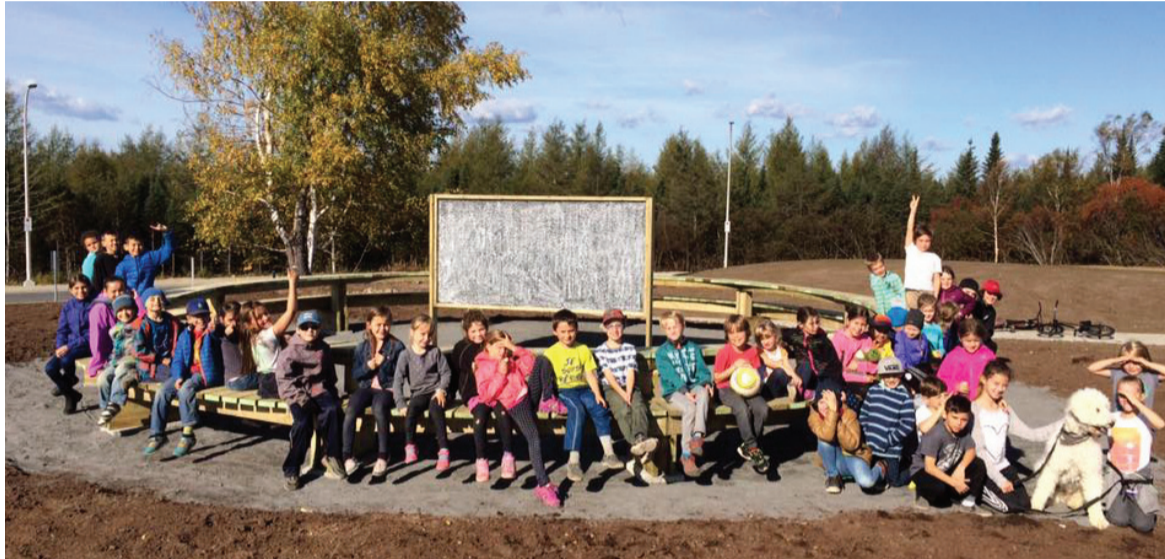
Voici la classe extérieure de l'école du Boisé de Sept-Îles.