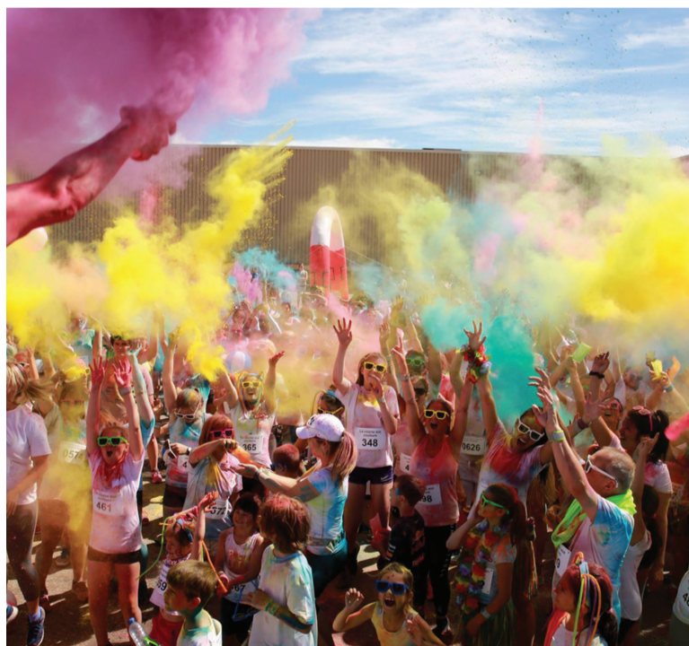
La Course aux couleurs - Mamu Galeries Montagnaises se tiendra le 25 juin prochain.