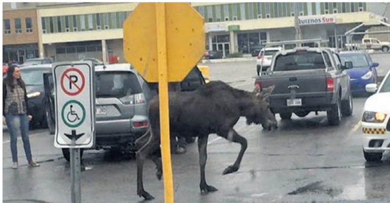
L'orignal s'est retrouvé en plein centre-ville, samedi.

Sept-Îles – L'un des deux orignaux qui se sont retrouvés en plein centre-ville samedi est mort après s'être enfui dans la baie de Sept-Îles. Les Septiliens ont eu toute une surprise quand un orignal s'est retrouvé en plein centre-ville, près de Place de Ville vers 9h15.