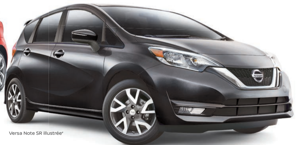
Versa Note SR illustrée*