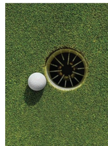
Le golf se jouera pour la Fondation régionale Hôpital Sept-Îles le 12 juillet prochain au Club Ste-Marguerite.