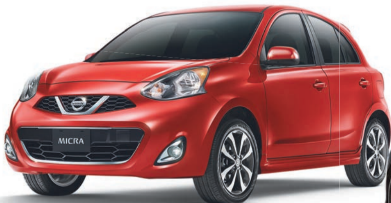
Micra SR illustrée*