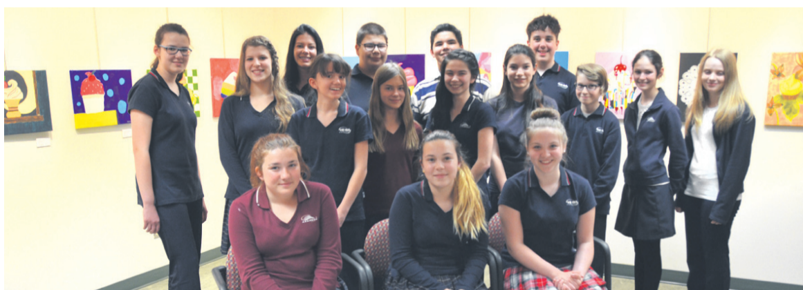
Plusieurs des élèves de l'option arts-plastiques de l'IESI

(E.M.) Environ une soixantaine d'invités ont pris part au vernissage de clôture de «Petit gâteau», le 24 mai à la salle jeunesse Port de Sept-Îles du Musée régional de la Côte-Nord. Une exposition réalisée par les élèves du programme Noir & Or arts plastiques-études de l'Institut