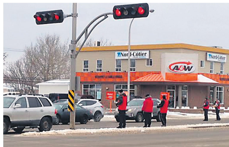
Tous unis pour Centraide est l'une des activités de financement de la campagne annuelle.

«Je suis ravi de voir le milieu des affaires, les grandes entreprises, les donateurs de tous les horizons et les bénévoles se mobiliser pour améliorer les conditions de vie et favoriser le bien-être des personnes les plus vulnérables des collectivités sur notre territoire», a indiqué M. Bonneau dans un communiqué transmis jeudi. L'an dernier, la campagne avait permis de récolter 560 625$.