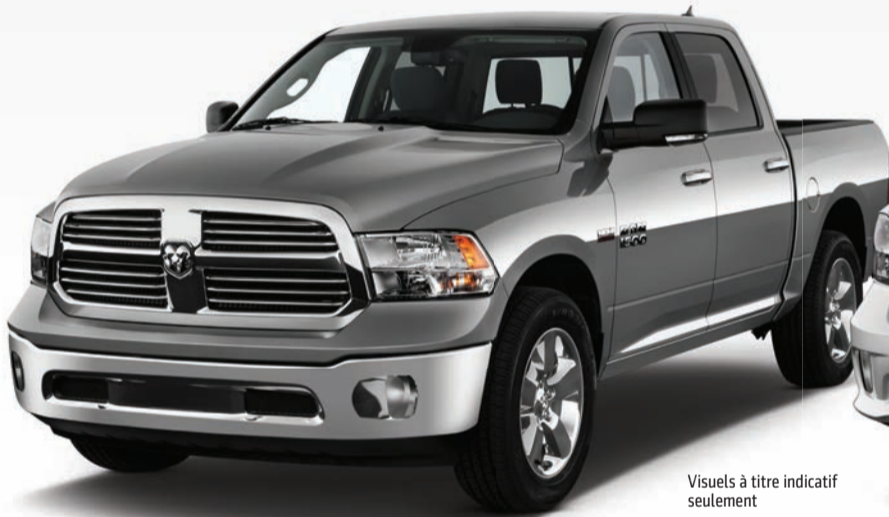
Visuels à titre indicatif seulement