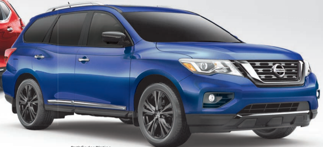
Pathfinder Platine Édition Minuit illustré*