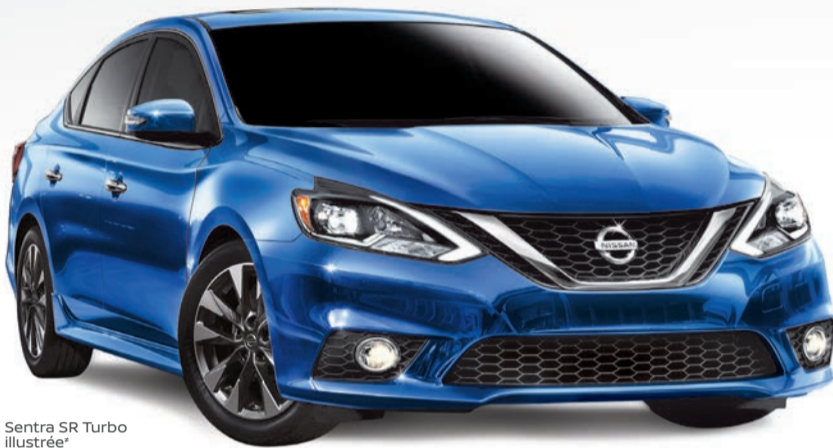
Sentra SR Turbo illustrée*