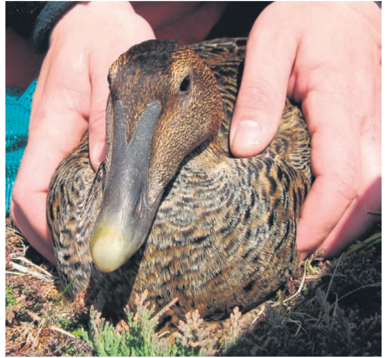
Le vol d'œufs d'oiseaux migrateurs est illégal.

Si on oublie son côté illégal, la collecte d'œufs peut s'effectuer sans trop de risques. En effet, même si les oiseaux sont en pleine période de reproduction et de ponte d'œufs, le directeur affirme