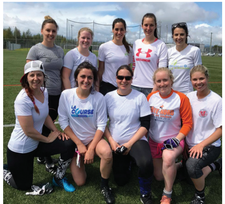
L'équipe gagnante chez les femmes, Bleu's Back.