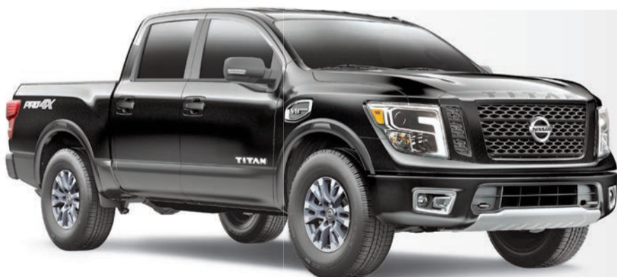
Titan Pro-4X illustré*