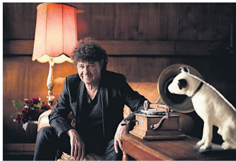
Robert Charlebois

Fruit d'une démarche intensive de recherche, J'aime Hydro (8 novembre) s'intéresse à la relation entretenue entre la société d'État et les Québécois. Cette production théâtrale représente le résultat d'une enquête citoyenne menée par la comédienne Christine Beaulieu qui est allée à la rencontre de spécialistes en énergie, de groupes de citoyens, de hauts dirigeants de la société d'État. Un théâtre documentaire sans partis pris.