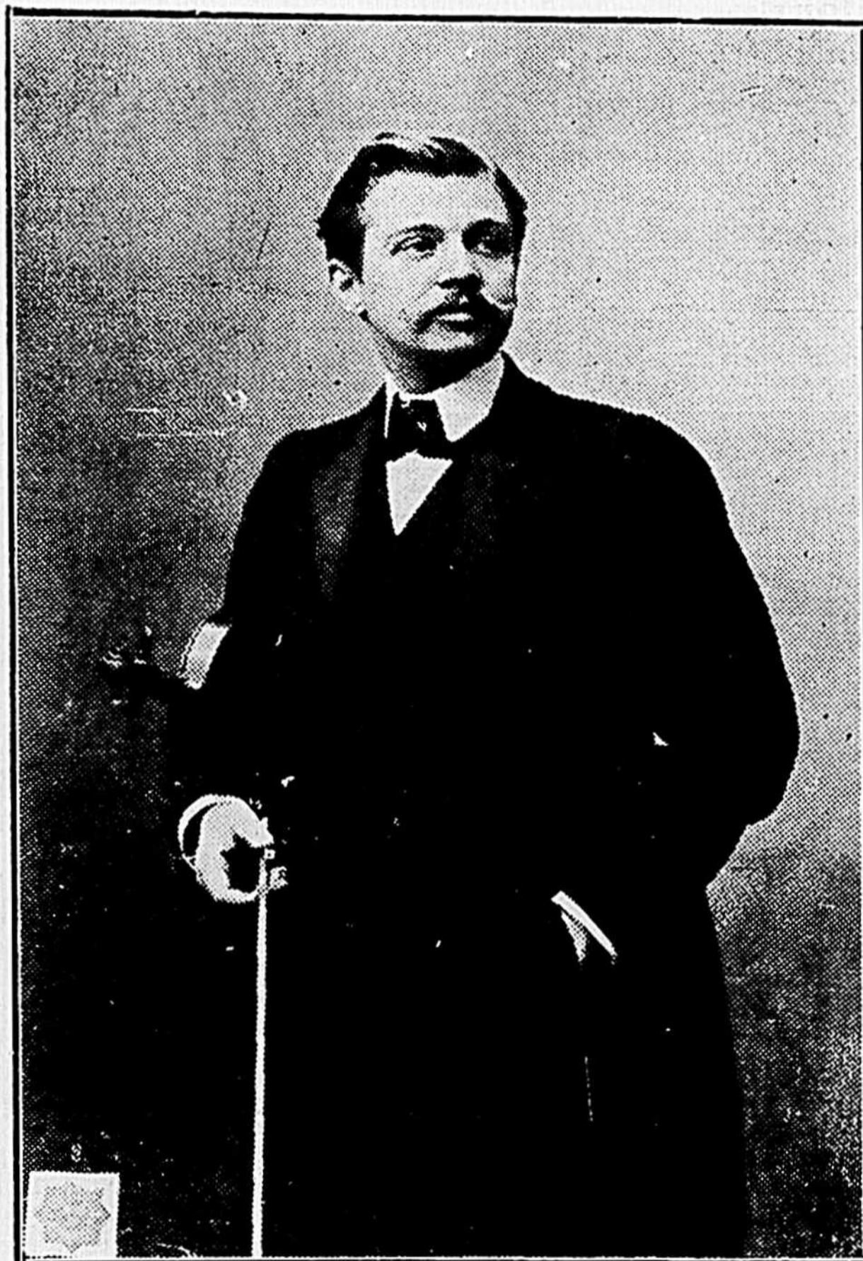
M. HENRI MARTEAU, le grand violoniste français Salle Windsor, le 6 février.