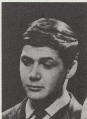
RODOLPHE : (Richard Martin) Je ne suis pas capable de voir saigner quelqu'un, ça me donne mal au cœur. Je dois tenir de toi, maman. Si c'était pas de ça, je me serais inscrit en médecine ! Parce que c'est payant la médecine.