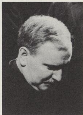
VICTOR : (Jean Duceppe) Moi, chaque jour, quand je sors du lit, je pense à mes affaires. Toute ma vie, toute notre vie en dépend, c'est notre forteresse, c'est notre roc de Gibraltar.