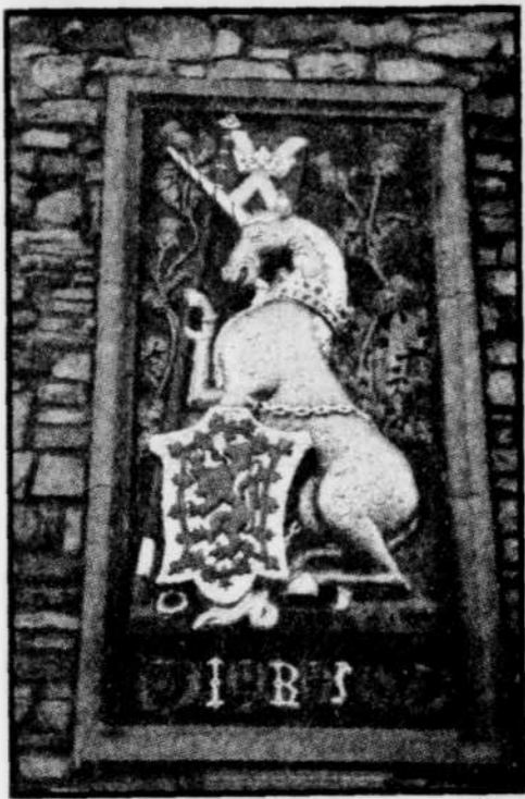
Emblème royal à Holyrood Palace

Édimbourg, cette belle grande capitale de l'Écosse, a de quoi charmer l'oeil des touristes. Ses châteaux, ses nombreuses maisons de style géorgien et ses autres édifices modelés sur la Grèce antique font de cette cité un coin intéressant à visiter durant la saison estivale. Ville natale de l'auteur de Sherlock Holmes et de l'interprète de James Bond, elle offre en août un festival des arts de réputation internationale. Claude Vaillancourt est allé faire un tour dans cette forteresse de la culture écossaise. Il livre son compte rendu dans les pages 2 et 3 du cahier.