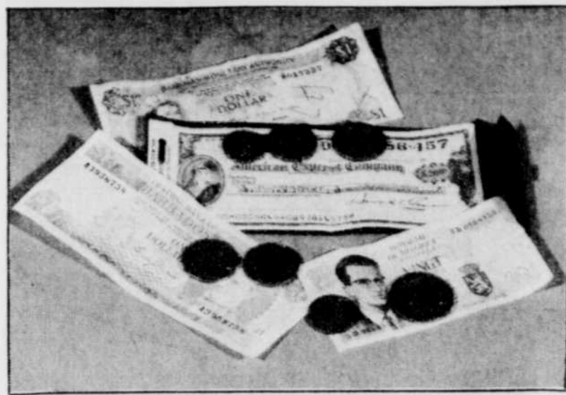
Les chèques de voyage en devises américaines demeurent le meilleur instrument de transactions à l'étranger.