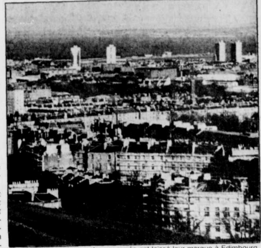
Des architectes de grande renommée ont laissé leur marque à Édimbourg.

Entre 1903 et 1910, on le retrouve aux États-Unis où il milite dans le mouvement ouvrier naissant. De retour en Irlande, il devint organisateur syndical et joua un rôle de premier plan dans la fondation du Parti travailliste irlandais.