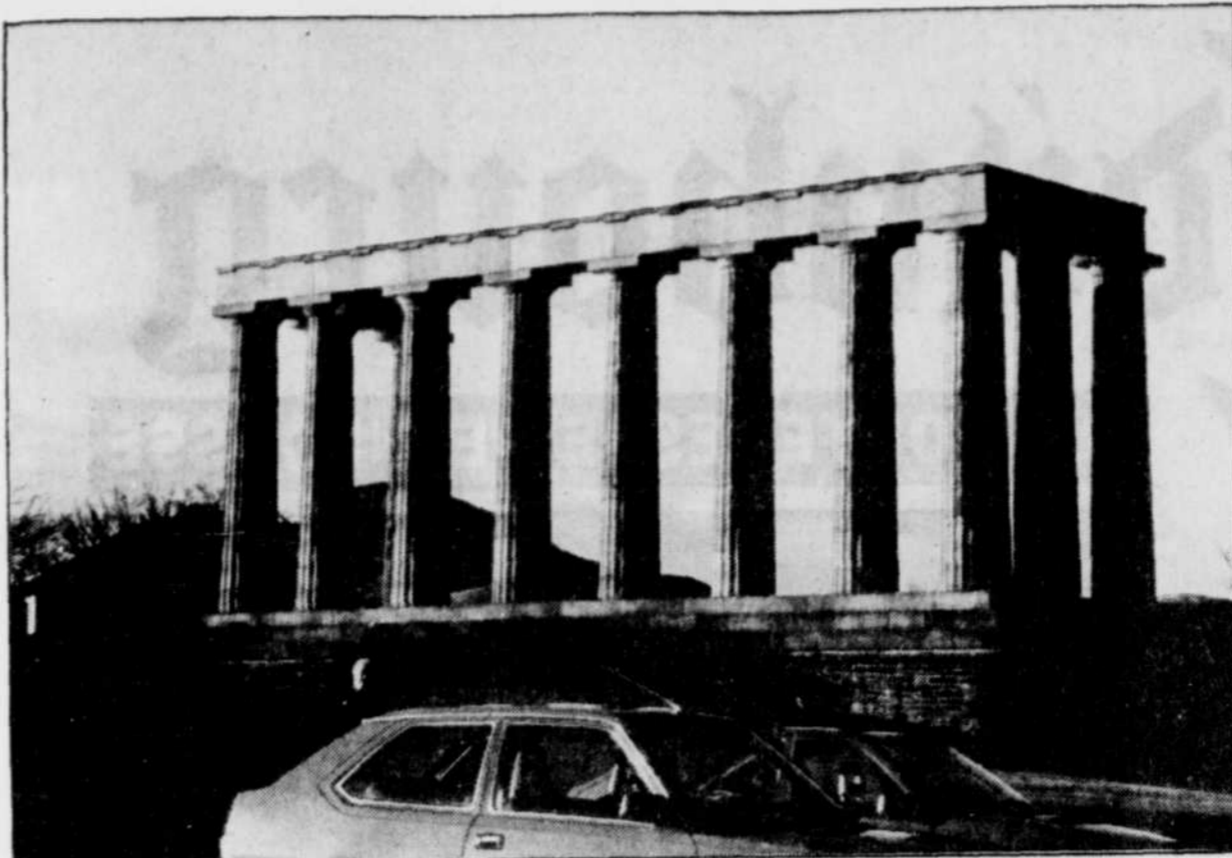
Édimbourg est considérée comme l'Athènes moderne. De nombreux monuments en témoignent dans toute la ville.

Pour bien saisir cette cité de 439,000 habitants, vaut mieux d'abord la visiter à bord d'un autobus. Le Lothian Region Transport , l'équivalent de notre Commission de transport de la Communauté urbaine de Québec, organise des excursions quotidiennes à bord d'autobus à deux étages au cours desquelles les vacanciers peuvent découvrir tout le charme de cette cité. Les départs, pendant la sai-