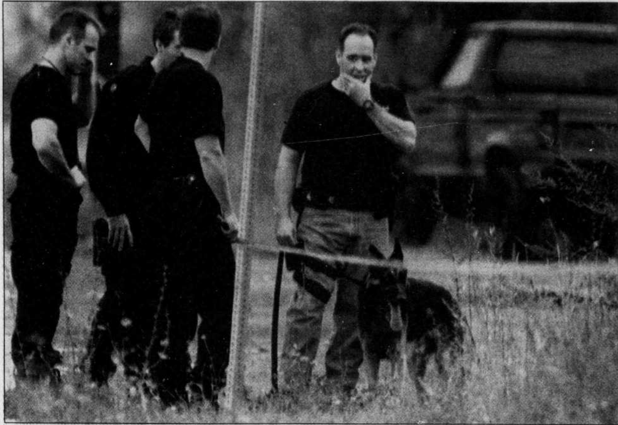
L'escouade tactique et un maître-chien ont été dépêchés hier matin sur les lieux d'une agression dont a été victime un gardien de prison de Rivière-des-Prairies.