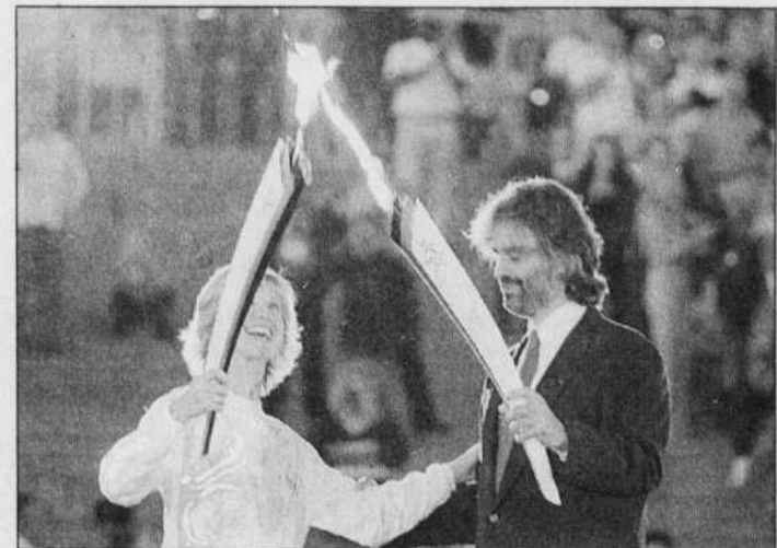
Olivia Newton-John et Andrea Bocelli.

Les principaux détails de la cérémonie n'étaient pas connus hier soir mais on savait déjà que le défilé des délégations allait être marqué par la présence côte à côte des athlètes des deux Corées et par l'apparition de la première délégation du Timor-Oriental.