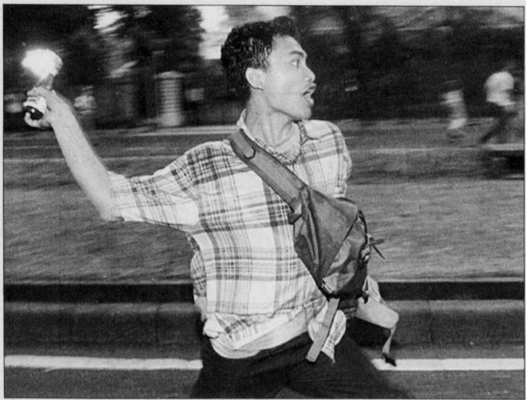
Un manifestant indonésien a lancé un cocktail Molotov à la police anti-émeute, hier à Jakarta.

Bravades au lendemain de la levée des sanctions contre Vienne