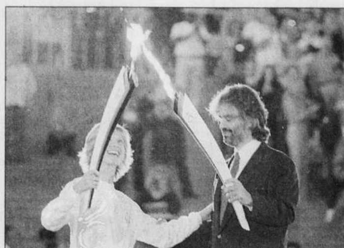
Olivia Newton-John et Andrea Bocelli.