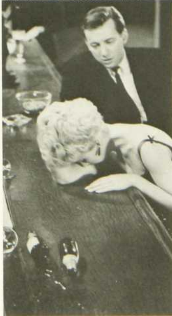
La Ballade des sans-espoir

La Ballade est un film insolite. S'il ne possède pas toutes les qualités du dernier film de John Cassavettes, il reste que le scénario du film est dense et l'intrigue bien amenée. La photographie est saisissante et l'ensemble se déroule comme une déchirante litanie.