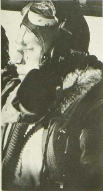
L'Homme qui aimait la guerre

Dans une réalisation habile et une photo de qualité, les acteurs de ce film, en particulier Steve McQueen, fournissent une interprétation pleine de vigueur et d'autorité.