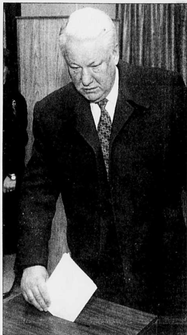
Le président Boris Eltsine a obtenu un soutien majoritaire pour son projet de constitution mais son parti, le Choix de la Russie, n'a pas récolté suffisamment de votes pour gouverner sans l'appui des autres formations.

Selon des indications de la commission électorale, la