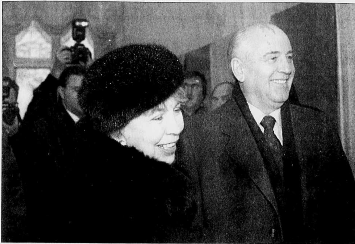
Le président Gorbatchev et sa femme Raïssa ont rempli leur devoir de citoyen hier à Moscou en participant au scrutin sur la constitution. Ils n'ont pas dit comment ils ont voté.