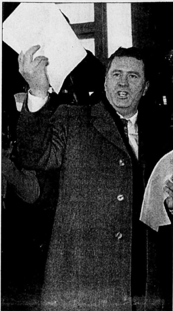
Le leader du Parti libéral démocratique, Vladimir Jirinovski, sort parmi les vainqueurs du scrutin d'hier en Russie. Son parti, d'extrême droite et ultranationaliste, récolterait environ 15% du vote selon les premiers résultats partiels.

Moscou (Reuter) — La Russie a dit «oui» hier au projet de constitution du président Boris Eltsine, dont les partisans paraissent en revanche mis en échec, dans le scrutin pour les législatives, par un fort courant d'extrême droite représenté par Vladimir Jirinovski. Selon des premiers résultats partiels, les communistes et les ultranationalistes obtiendraient plus de sièges au parlement que les réformistes.