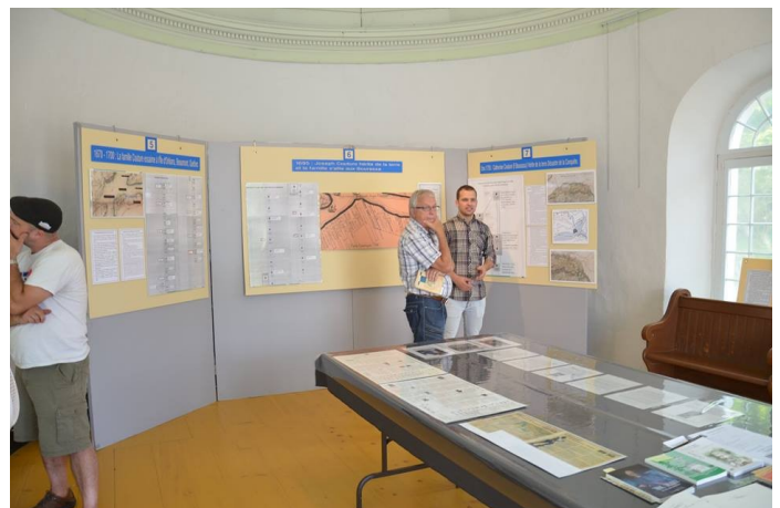
Aperçu de l'exposition, été 2014