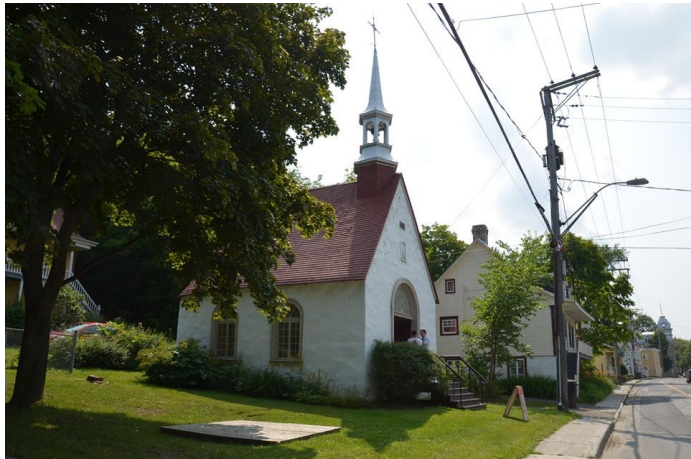
Chapelle de Saint-François-Xavier