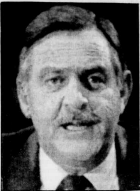
Roepik Botha, ministre sud-africain des Affaires étrangères.