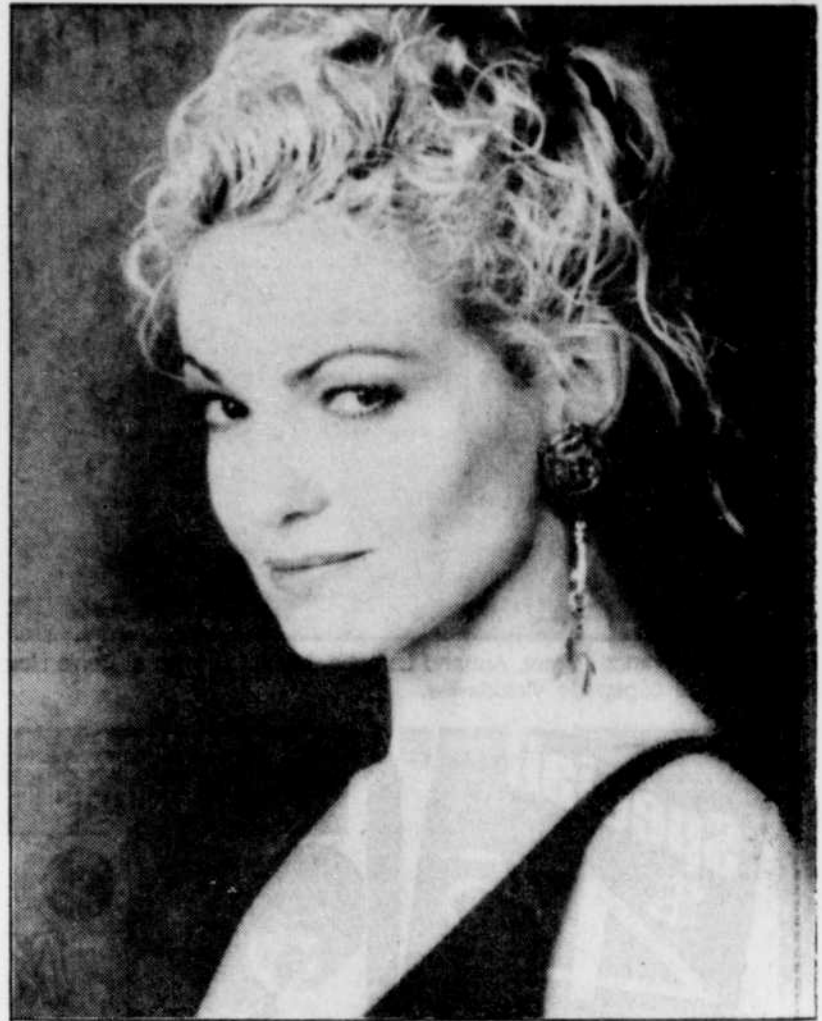
Marjo encourage les jeunes groupes... qui « rockent » en français!

Après ce spectacle hommage, Marjo continuera de se promener à travers les festivals québécois et entend prolonger sa tournée jusqu'en décembre. En tout, elle aura présenté son show « Tant qu'il y aura des enfants » 140 fois plutôt qu'une. Puis, dès janvier, elle retourne à l'écriture des chansons d'un nouveau disque qu'elle promet plus rock que jamais.