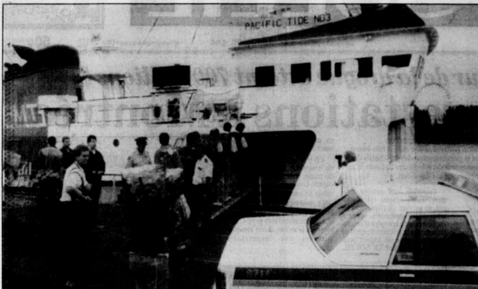
La Sûreté du Québec a arrêté l'équipage du remorqueur Pacific Tide 3 et perquisitionné à bord du navire, hier, dans le port de Montréal. L'opération policière a été déclenchée dès l'accostage du remorqueur au port, et après que 40 barils de plastique bleus aient été repêchés dans le Saint-Laurent, au large de la rivière Mingan sur la Côte-Nord, mercredi.