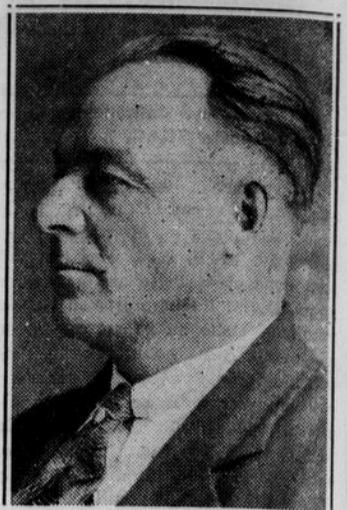
M. Maxime Bourassa, maire de St-Paulin Village, réélu préfet du comté de Maskinongé.