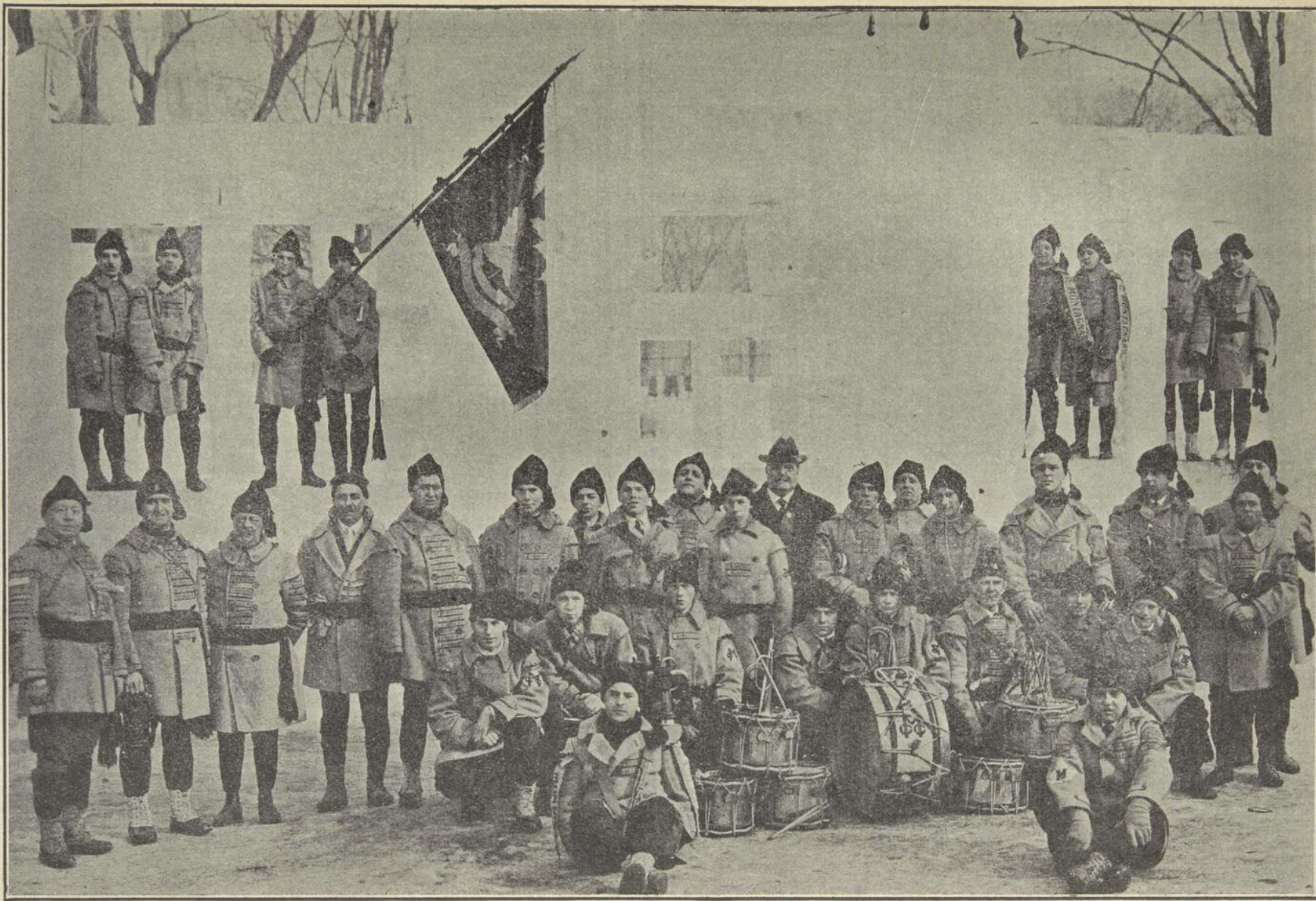
Groupe de Montagnards photographiés à Lewiston, lors de la convention des raquetteurs en 1925.