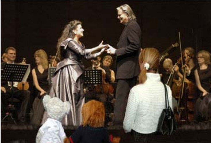
Mademoiselle X et les deux mascottes, Miss Gym et son frère Monsieur X, à un concert d'opéra de Cecilia Bartoli.

«La vérité dépasse peut-être la fiction en cela qu'elle est infiniment plus décevante.»