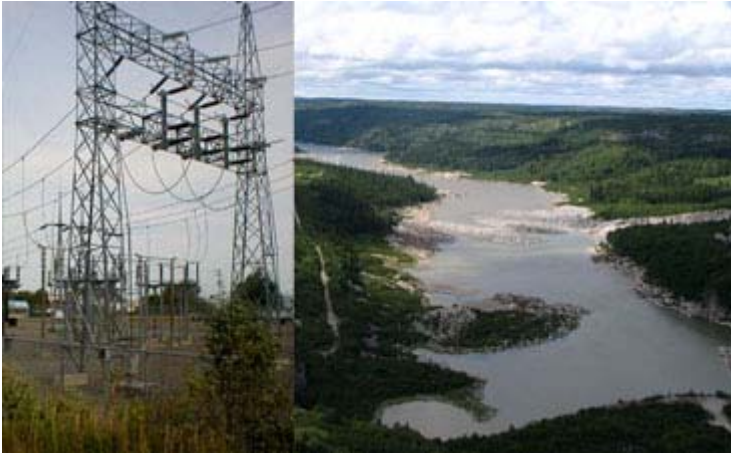
Lignes électriques et barrage d'une rivière

Le marché de l'électricité connaît d'importants bouleversements en Europe alors que les compagnies productrices sont la cible d'offres d'achat et de fusion atteignant des milliards $, offres provoquées par le libre marché et la déréglementation. La situation au Québec est entièrement différente et la société Hydro-Québec continue de dominer son marché et de constituer un moteur économique local. Les revenus ont atteint 3,74 milliards $ en 2006 et le président Thierry Vandal, qui était le récent conférencier devant Le Cercle de la Finance internationale de Montréal , a déclaré que ses plans pour 2007 s'appuient sur un développement durable au niveau de l'amélioration des installations. Actuellement, le total des divers projets en cours de réalisation atteint la somme de 8 milliards $.