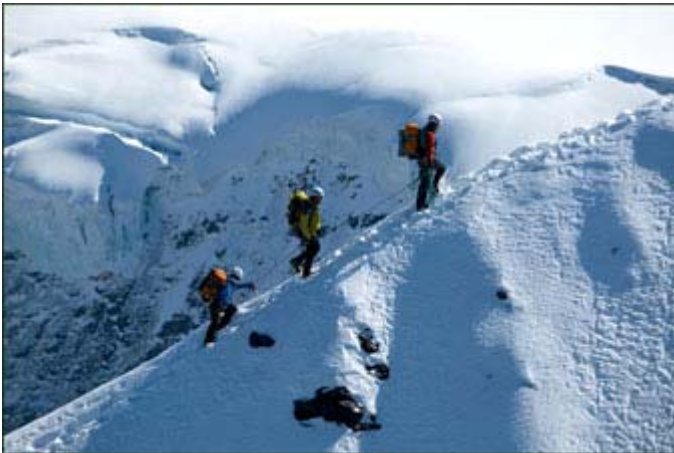
Image du film Les Alpes