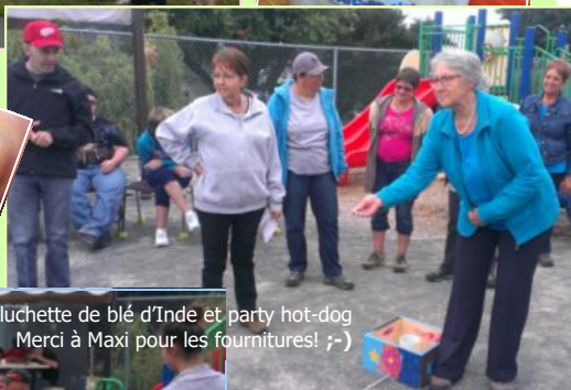
Épluchette de blé d'Inde et party hot-dog Merci à Maxi pour les fournitures! ;-)