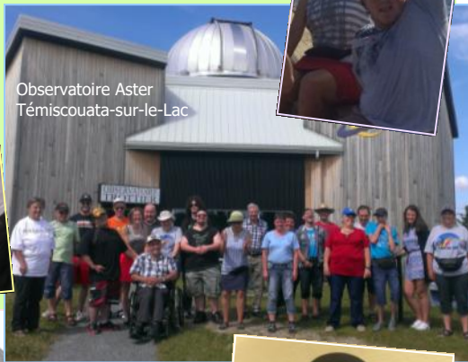
Observatoire Aster Témiscouata-sur-le-Lac