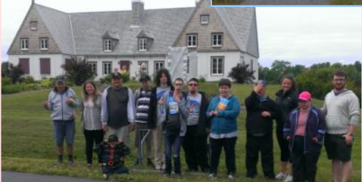
Musée de la mémoire vivante