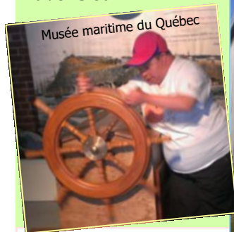
Musée maritime du Québec

En ce début d'automne, voici quelques belles photos de nos activités estivales, histoire de se rappeler les beaux moments que nous avons eu!