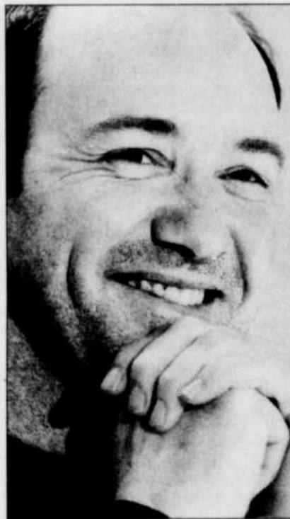
Kevin Spacey a choisi de prendre une pause dans sa carrière d'acteur, question de se concentrer davantage à sa nouvelle compagnie de production.