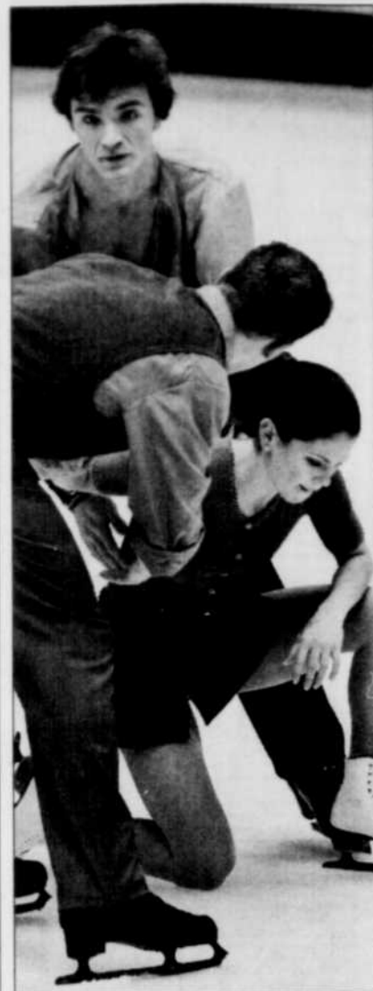
Pendant la période de réchauffement, Jamie Salé est entrée en collision avec le Russe Anton Sikharulidze.