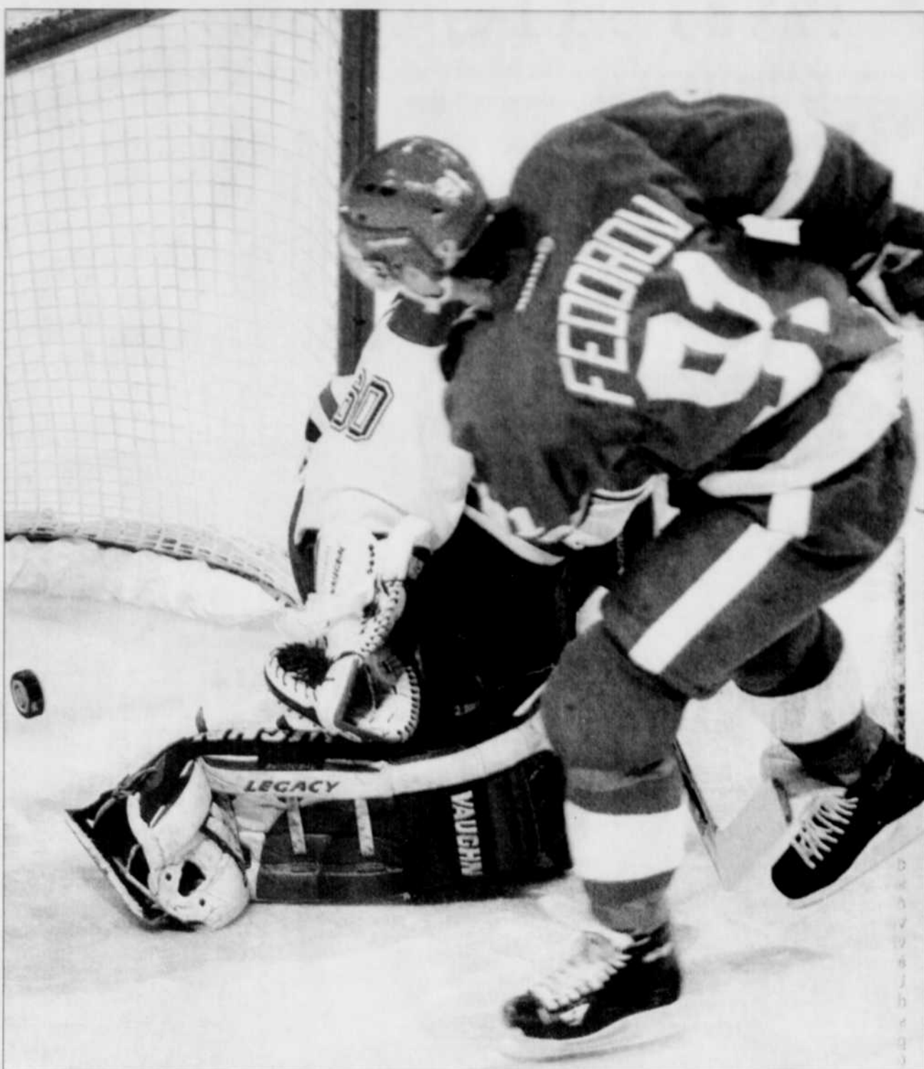
Sergei Fedorov a compté deux buts dans la victoire de 3-2 des Red Wings de Detroit.