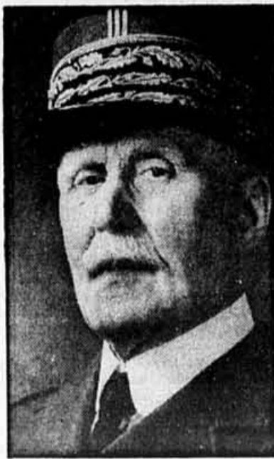
Le maréchal Pétain

Mais comment expliquer tout cela au-delà de la situation tragique qui régnait en France en ce temps-là? Marc Ferro fait donc appel à la psychologie. Il replace cet homme particulier dans son contexte. Ce qu'a été Pétain durant la guerre s'expliquerait donc partiellement par les traumatismes dont il fut lui-même la victime, traumatismes sociaux s'entend. Les gens de sa génération n'en manquèrent pas, que