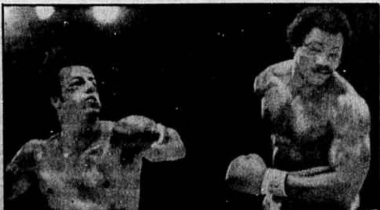
Rocky Balboa (Sylvester Stallone) et Apollo Creed (Carl Weathers).

21:00 1 — «L'amour nu» De Yannick Bellon, un film sur les séquelles du cancer du sein dans la vie d'une femme. Avec Marlène Jobert et Jean-Michel Folon.