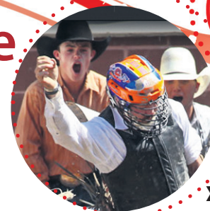
STAMPEDE DE CALGARY

À 14 h aura lieu le défilé du grand serment au Canada avec Ramesha Drums et la troupe des tambours du Burundi, qui précédera notamment la cérémonie du Grand Serment au Canada et un spectacle de danses multiculturelles.