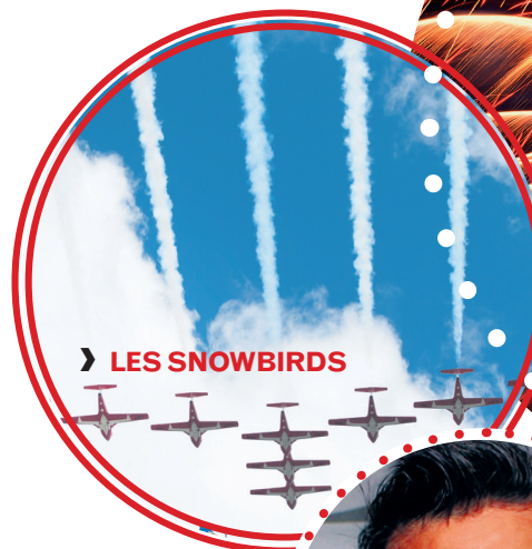
&gt; LES SNOWBIRDS