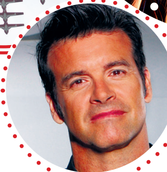
&gt; ROCH VOISINE