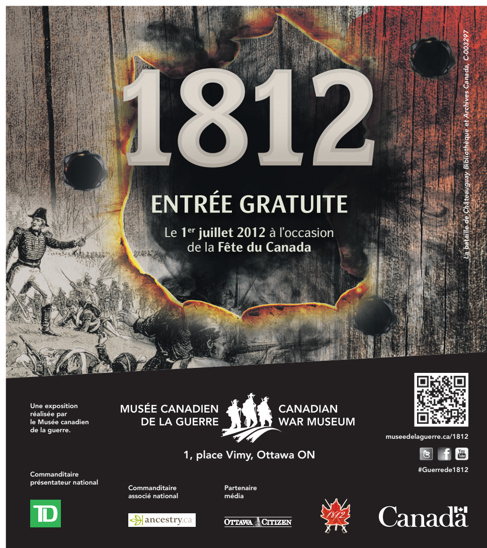
La bataille de Châteauguay, C-003297