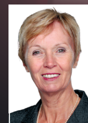
Nycole Turmel Députée de Hull-Aylmer nycole.turmel@parl.gc.ca www.nycoleturmel.ca