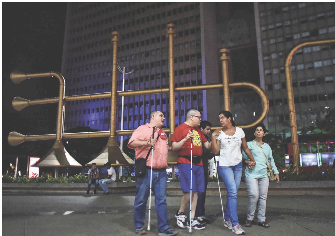
Des voyageurs participant au programme visitent la plaza Jairo Varela, au centre de Cali.