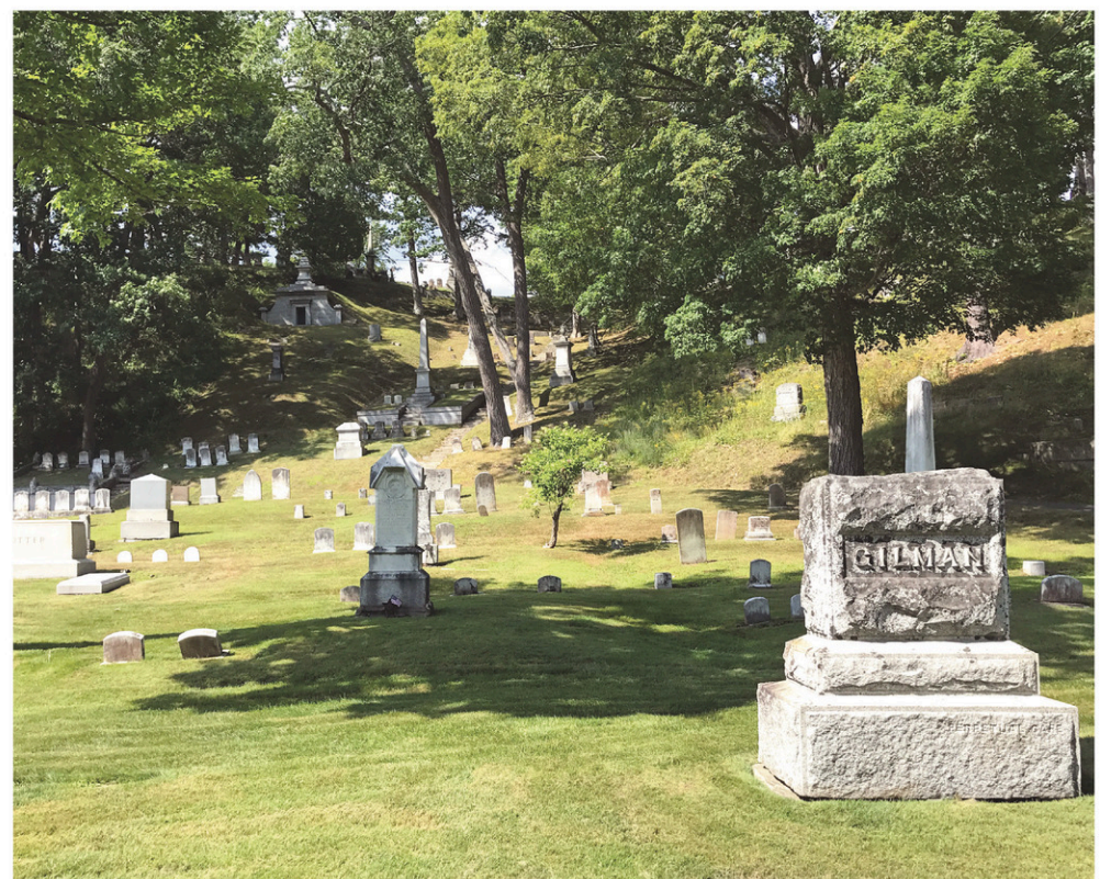
Le cimetière-jardin Mount Hope, à Bangor, a servi de lieu de tournage pour le film Pet Semetary (1989), qui a terrifié toute une génération.