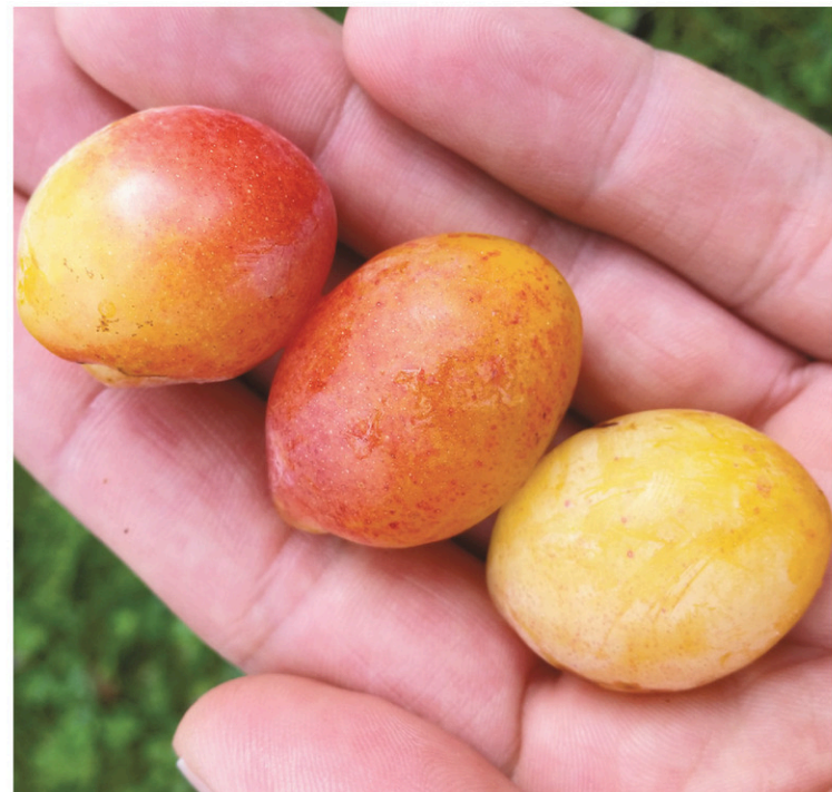
CHARLES DE BLOIS-MARTIN

continental de Cowansville, où elle vit maintenant.