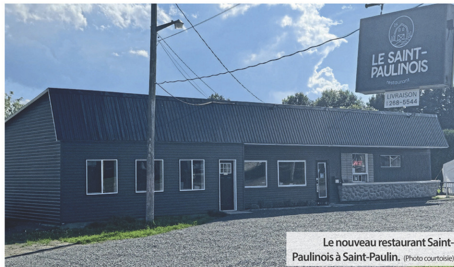
Le nouveau restaurant Saint-Paulinois à Saint-Paulin.

En effet, ils s'approvisionnent chez divers marchands du secteur tels que Monsieur Champignons,