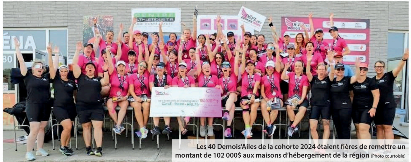
Les 40 Demois'Ailes de la cohorte 2024 étaient fières de remettre un montant de 102 000$ aux maisons d'hébergement de la région

En cinq jours, elles ont couru 750 km à travers la région: Nicolet, Sainte-Monique, Trois-Rivières, Cap-de-la-Madeleine, Shawinigan-Sud, Lac-à-la-Tortue, Saint-Georges-de-Champlain, Pointe-du-Lac et Saint-Boniface.