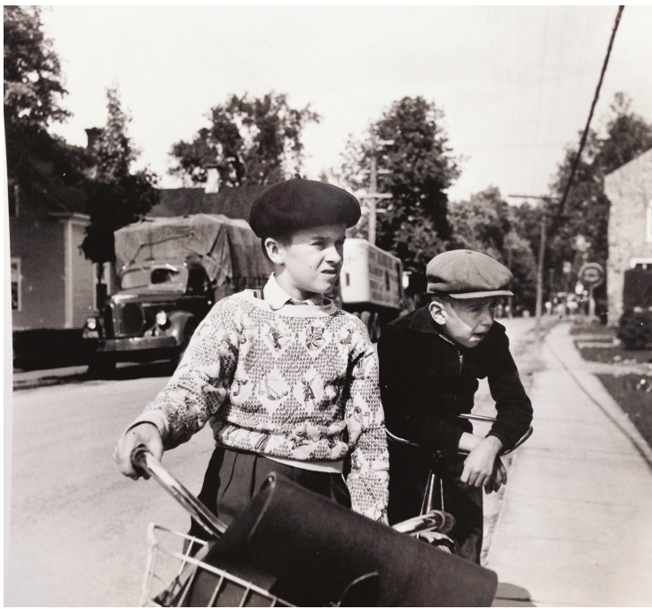
LIDA MOSER/MUSÉE NATIONAL DES BEAUX-ARTS DU QUÉBEC

En juin de cette année-là, elle débarque dans la très achalandée gare Windsor. «Quand j'ai débarqué à la gare Windsor [...], j'ai été surprise