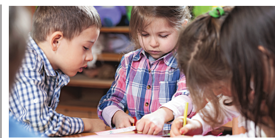
Yves Bolduc ne veut pas que les enseignants fassent la « promotion » de la diversité sexuelle.