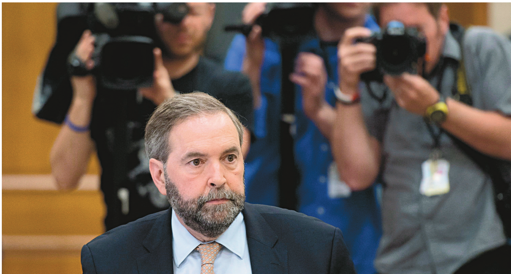
En mai, le chef du NPD, Thomas Mulcair, avait dû comparaître en comité parlementaire au sujet de l'utilisation des fonds parlementaires pour des bureaux satellites.