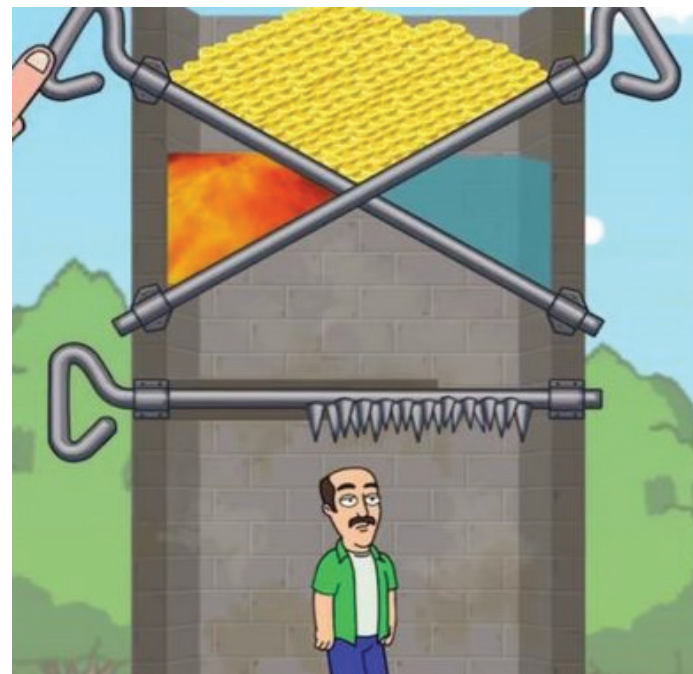
Un certain jeu potentiellement trompeur

Malheureusement, il arrive que le jeu proposé dans la publicité ne corresponde pas à ce à quoi on pouvait s'attendre! Même quand on a pu le tester! Ce que je ne comprends pas, c'est en quoi il est légal que ces campagnes de publicité puissent proposer autre chose que leur produit! C'est trompeur! Il m'est