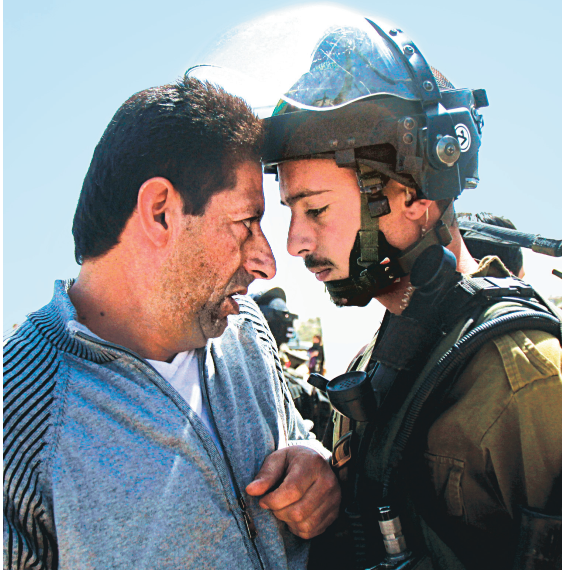
Face-à-face entre un Palestinien et un soldat israélien.

Vingt ans après les accords d'Oslo et la célèbre poignée de main entre Yitzhak Rabin et Yasser Arafat, et alors que redémarrent des négociations entre les deux peuples en conflit, où en sont les esprits dans cette région tourmentée de la planète ?