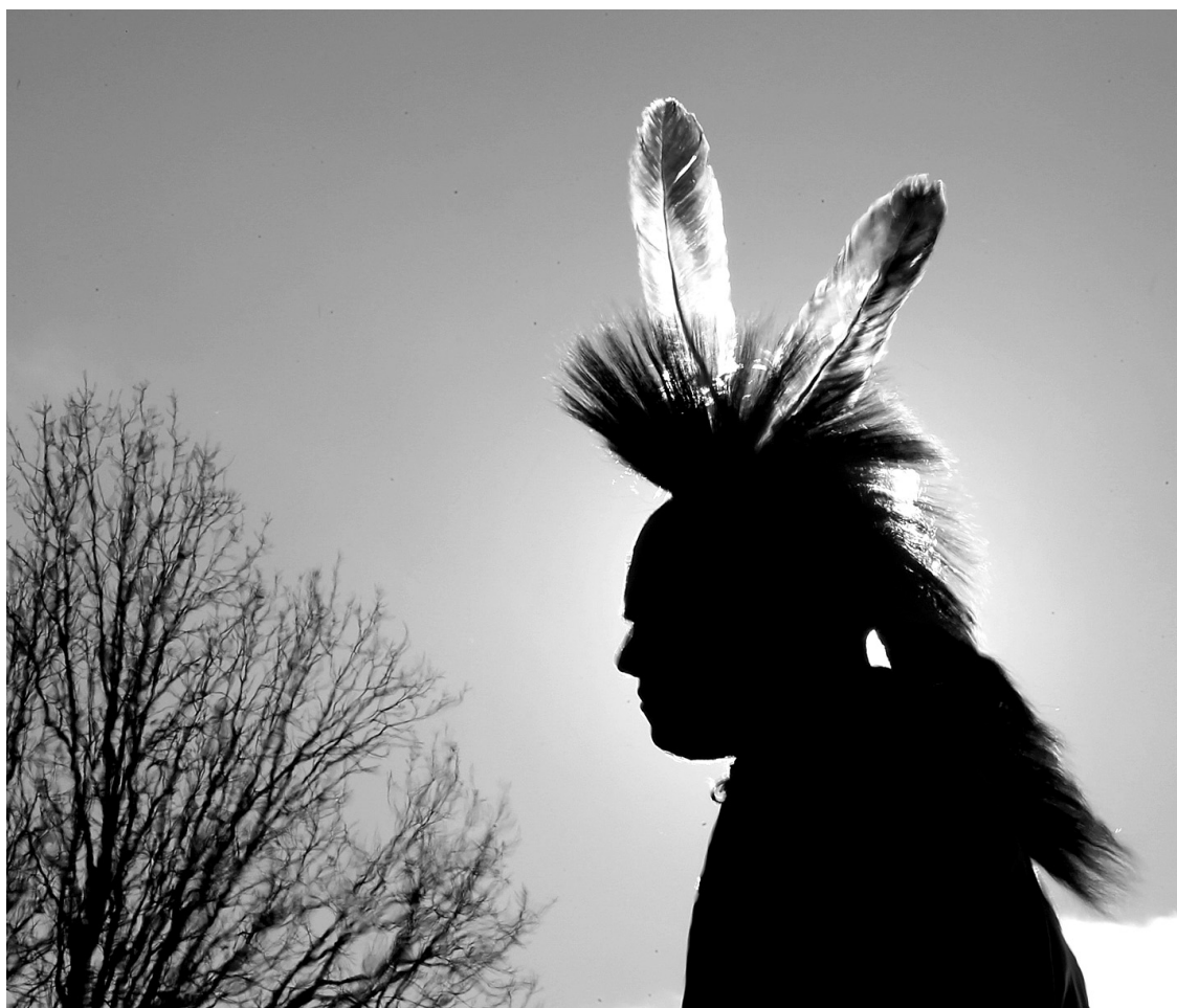
DAVE CHIDLEY LA PRESSE CANADIENNE

« Nous allons tout remettre à la communauté. Mais nous avons une entente avec la communauté huronne selon laquelle nous pouvons garder quelques échantillons de ces