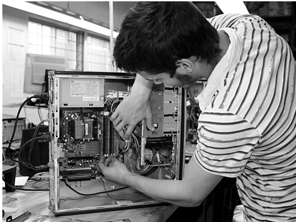
Insertech, qui redonne une seconde vie aux ordinateurs défectueux ou désuets, fait partie de la liste des entreprises d'économie sociale retenues pour le projet-pilote.

Les entreprises d'économie sociale ont effectué une percée «marginale» du secteur public au fil des dernières années, a confié M me Cyr. Elles réussissaient bon an mal an à mettre la main sur des contrats totalisant moins de