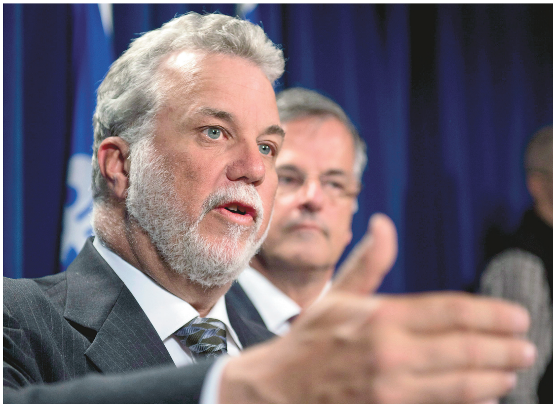
Philippe Couillard souhaite une mise à jour des finances québécoises d'ici au 30 septembre.

Le ministre Marceau a convenu dernièrement que les revenus escomptés grâce à la taxe de vente (TVQ) se faisaient plus rares que prévu, ce qui pourrait menacer l'atteinte de l'équilibre budgétaire le printemps prochain. «Le retard de revenus est d'au moins 1 milliard.