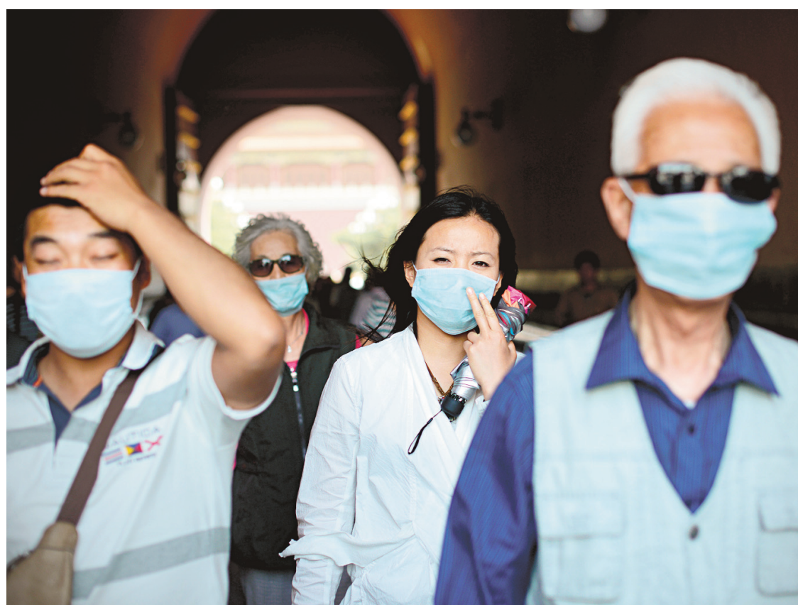
Des touristes chinois visitant la Cité interdite en mai dernier. La Chine souhaite investir 285 milliards de dollars au cours des cinq prochaines années pour combattre la pollution de l'air.