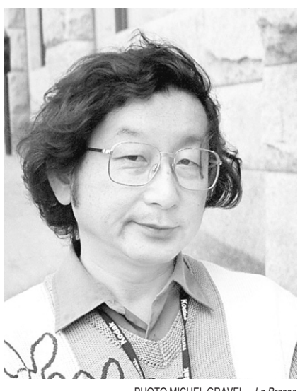
Akitoshi Asazuma, journaliste japonais.