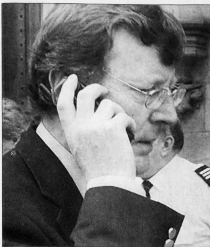
L'Assemblée locale d'Irlande du Nord a pris acte hier de la démission de David Trimble de son poste de premier ministre.