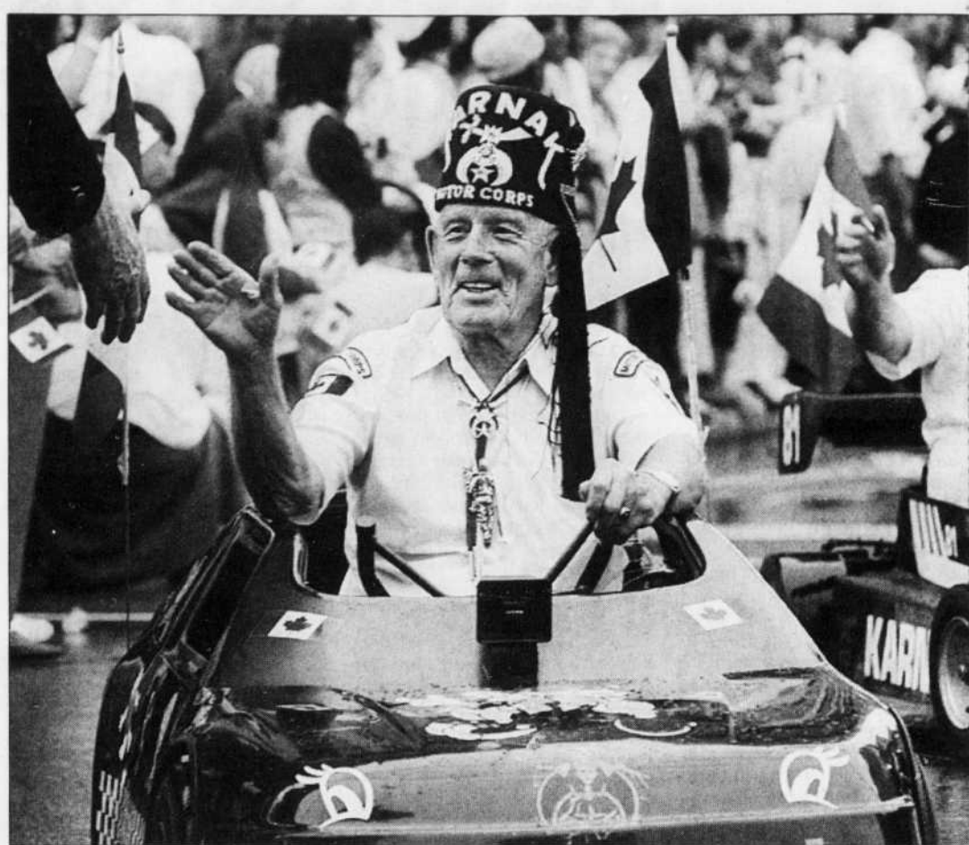
Les participants au défilé, à Montréal, ont rivalisé d'originalité pour attirer l'attention des quelque 20 000 spectateurs venus célébrer la Fête de la Confédération.

À Montréal, il y a eu un défilé rue Sainte-Catherine qui aurait attiré environ 20 000 personnes. La pluie était au rendez-vous dans la métropole également. On a célébré en outre dans certains quartiers et dans le Vieux-Port avec