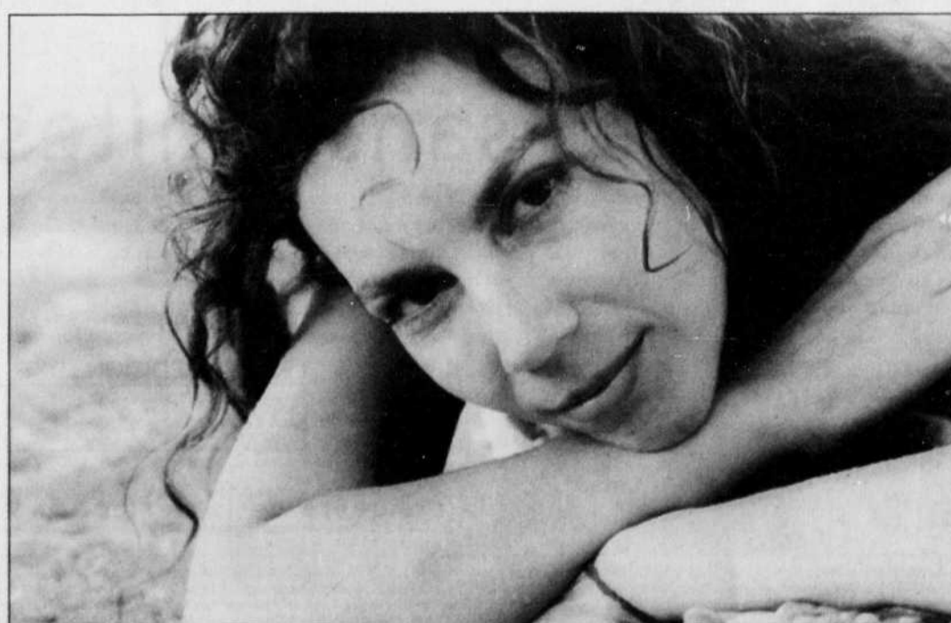
Qu'elle chante à Montréal ou à Natashquan, Bia offre le même spectacle.

Au pays de Gilles Vigneault, la faim de chanson est criante