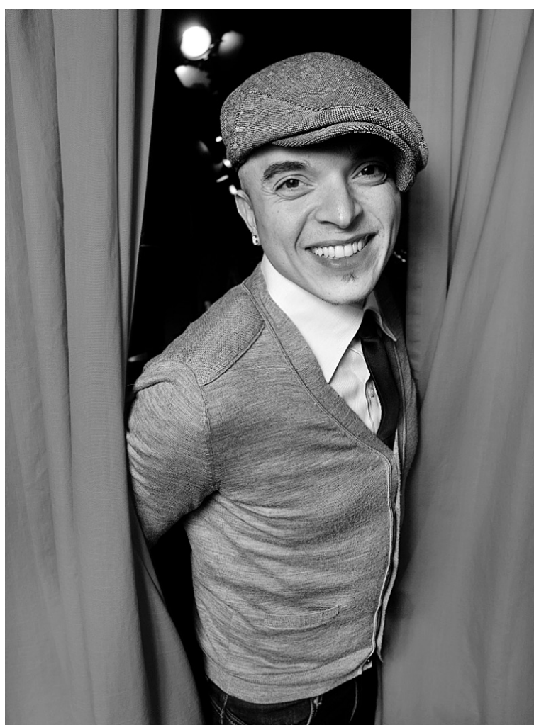
L'humoriste était au Quartier Latin hier dans le cadre d'un mandat de promotion.

En plus d'avoir séduit le public venu l'applaudir sur scène, l'humoriste a su charmer les téléspectateurs français en collaborant au talk-show d'Arthur diffusé sur Comédie+. On peut