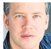
MARC CASSIVI CHRONIQUE

« Je vois un ruban rose et c'est comme si c'était écrit: Fabriqué en Chine », dit une femme dans la jeune quarantaine, en phase terminale d'un cancer du sein.