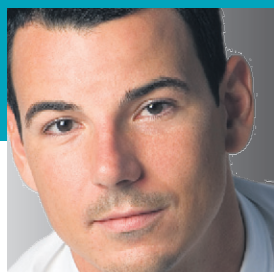
HUGO DUMAS QUELLE FAMILLE, CES O'HARA! PAGE 3