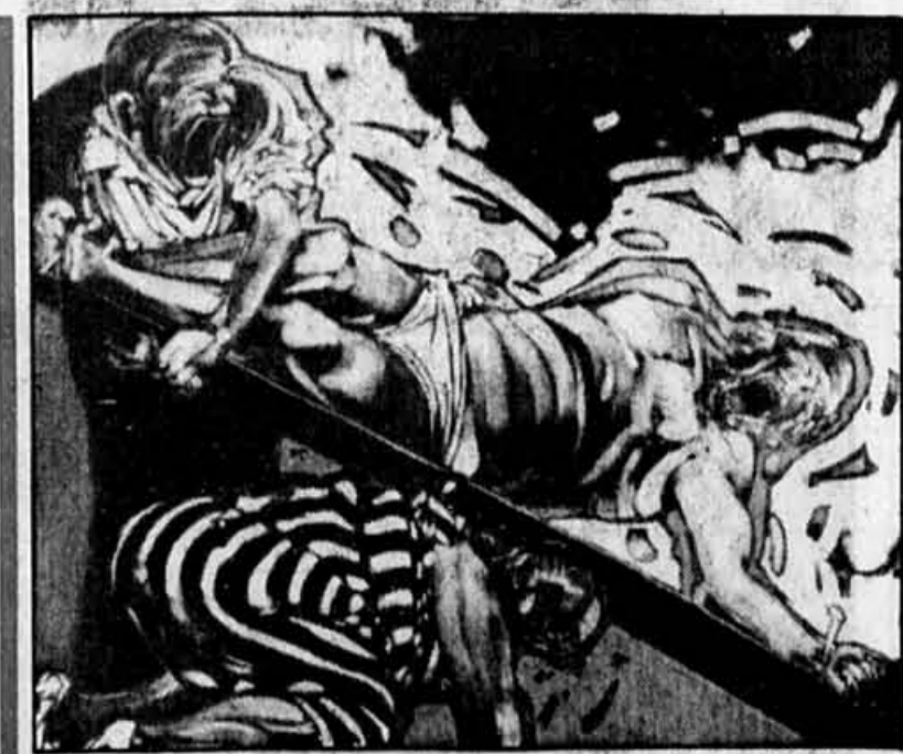
« Jesus Freak », Robert Deschênes