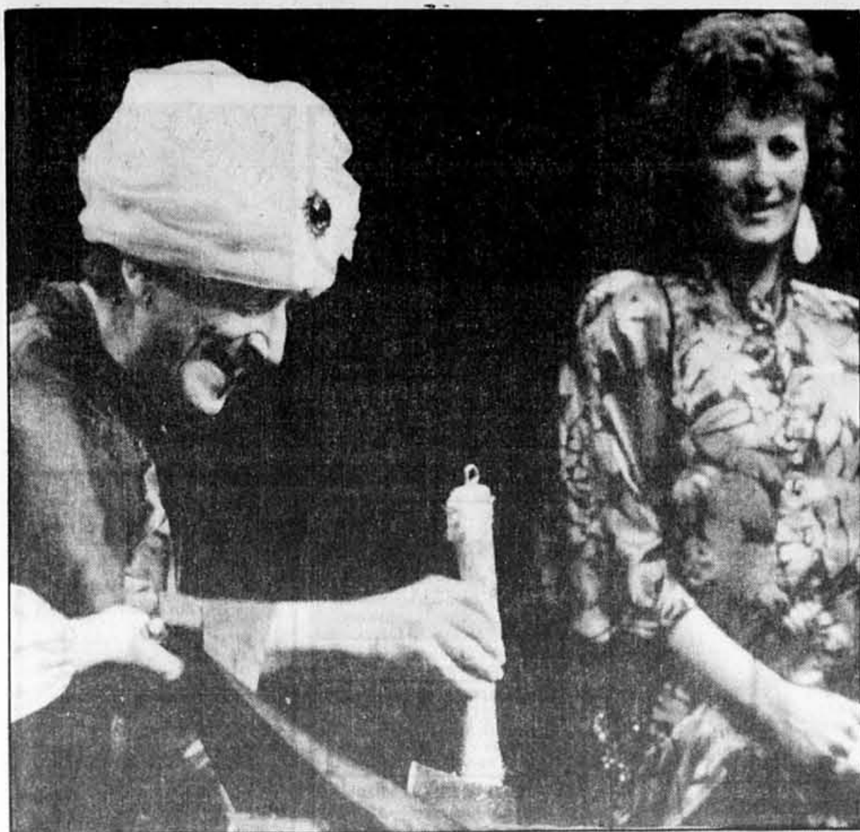
Jean Lapointe, le magicien