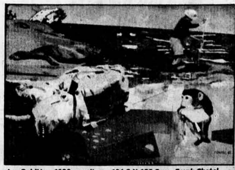
« Les Oubliés », 1986, acrylique, 121,9 X 182,8cm, Frank Chatel