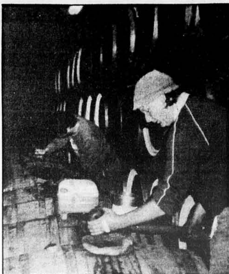
La mise en fûts d'un vin rouge, chez Thomas Hardy & Sons, dans l'état de South Australia.

Plus rares, les vintage ports à l'australienne — des vins pour lesquels le vieillissement se fait surtout en bouteilles — sont élaborés eux aussi surtout avec de la Syrah. Toutefois, au contraire des tawnies dont le style est toujours plus ou moins le même, ils peuvent être très différents les uns des autres : légers, moyennement corsés, ou alors si