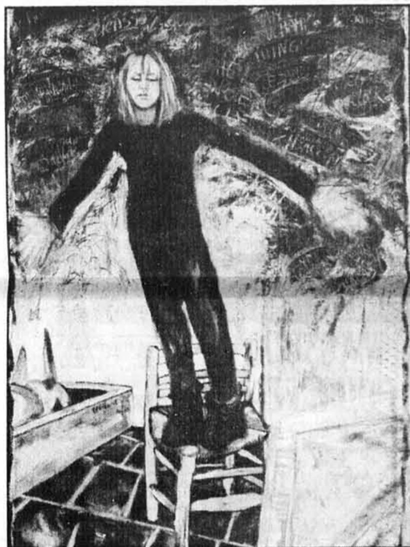
« Binacul'art » 1986 Huile sur toile 182,8 X 91,44cm François-Alfred Migoncourt