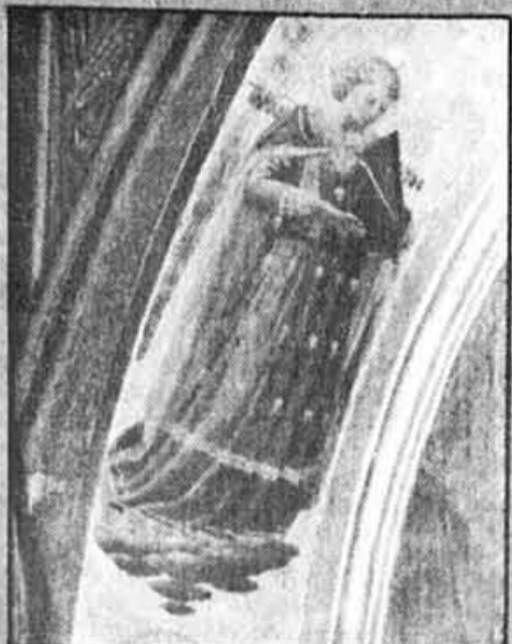
L'Ange musicien de Fra Angelico ; la révolution dans l'édition d'art.

Fra Angelico y brille de toute la lumière de son âme de religieux, serviteur de l'art en même temps que de Dieu, pour qui la beauté était une manifestation de la grâce divine.