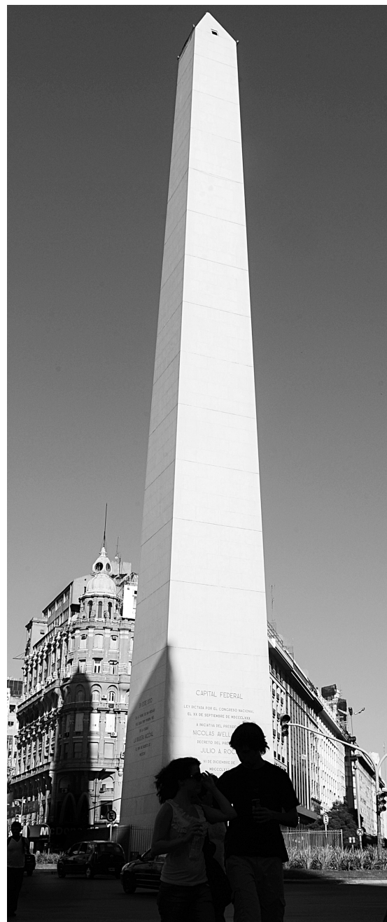
L'obélisque emblématique de Buenos Aires, en Argentine: haut de 67 mètres, il fut érigé en 1936.

■ Le Guide récréo-touristique du Québec - 4 saisons , chez Broquet, une bible des lieux, des pourvoiries, des campings, des gîtes. Si, avec ce recueil, on se perd ou on ne trouve rien, il y a un problème. En