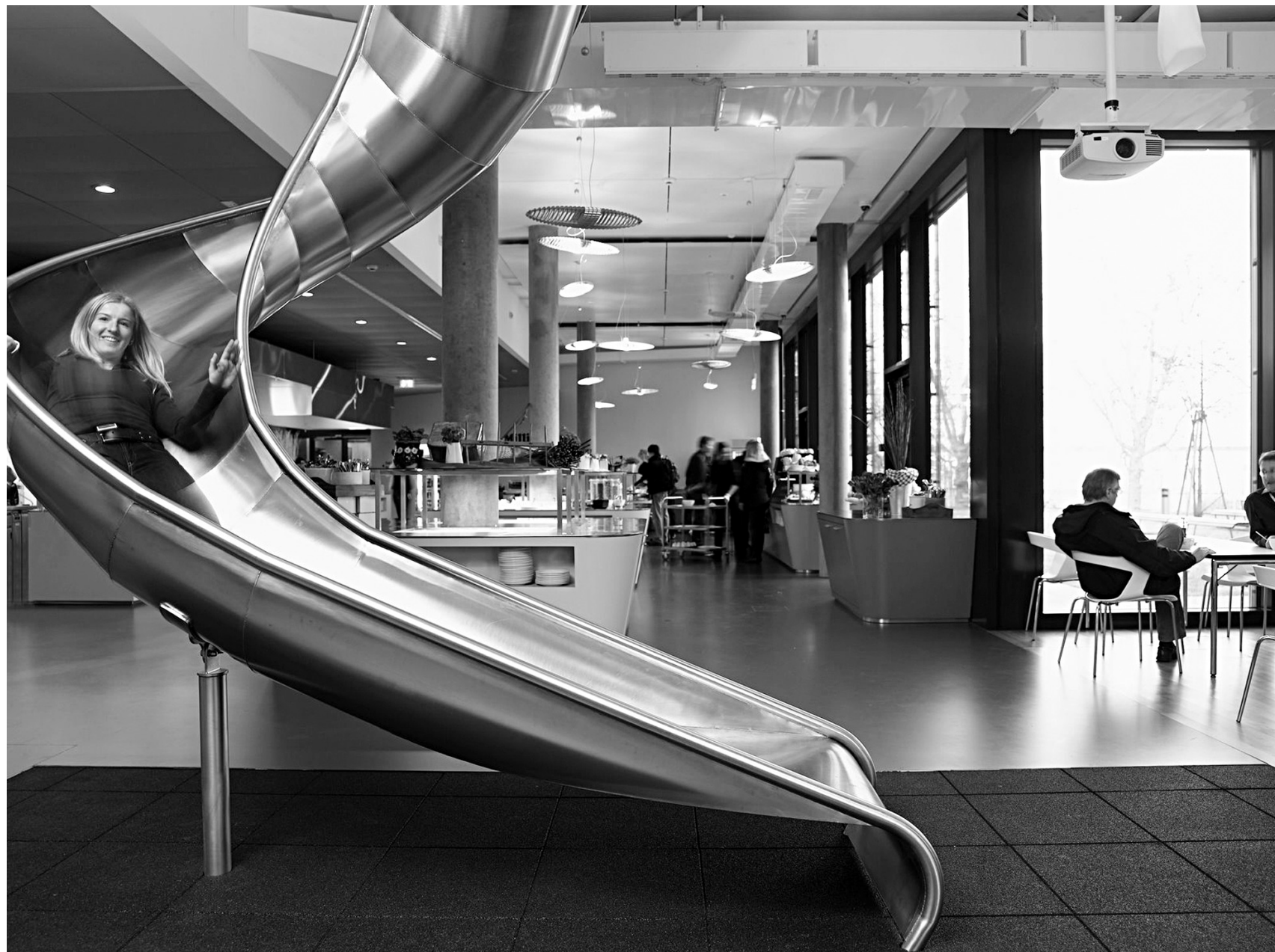
La «ludification» de l'environnement est stimulée par des entreprises qui ne se privent pas, elles-mêmes, pour y succomber, comme en témoigne ce cliché du quartier général de Google en Californie.

Et ce n'est qu'un début. La ludification du monde, de la vie en société, du commerce... devrait continuer à bien se porter, merci. Surtout dans un univers où domine le culte de l'instant — et du présent —, la multiplication des alvéoles numériques de la communication à remplir sur une base temporelle de plus en plus rapide, tout com-