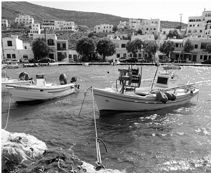
Le village de Panormos.

Questions, bonnes adresses, découvertes, trucs, envies, bons et mauvais souvenirs de voyage: lkiefer@ledevoir.com . Blogue: www.ledevoir.com/liokiefer .