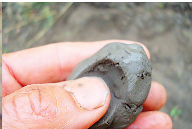
Les différents types de texture de sol: sur la première photo, le loam sableux, sur la seconde, le loam, et finalement, le loam argileux.