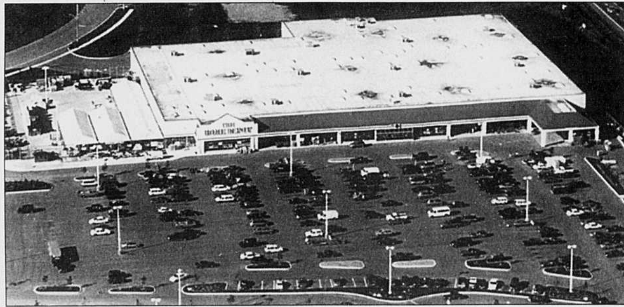
C'est ce genre de magasin que compte ouvrir la compagnie dans la région métropolitaine de Montréal: trois d'abord, entre 15 et 20 à plus long terme.