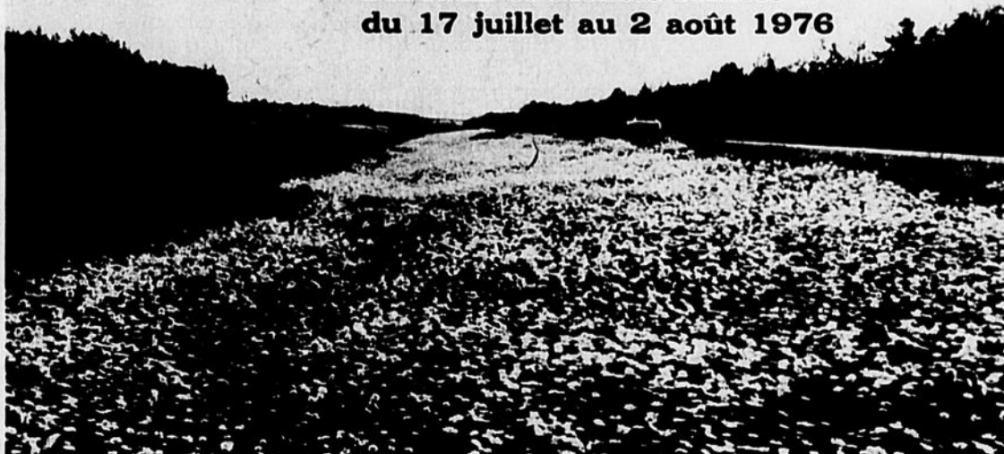
Les neiges de l'été vue de la Transcanadienne en juillet

Bureaux et ateliers fermés du 17 juillet au 2 août 1976