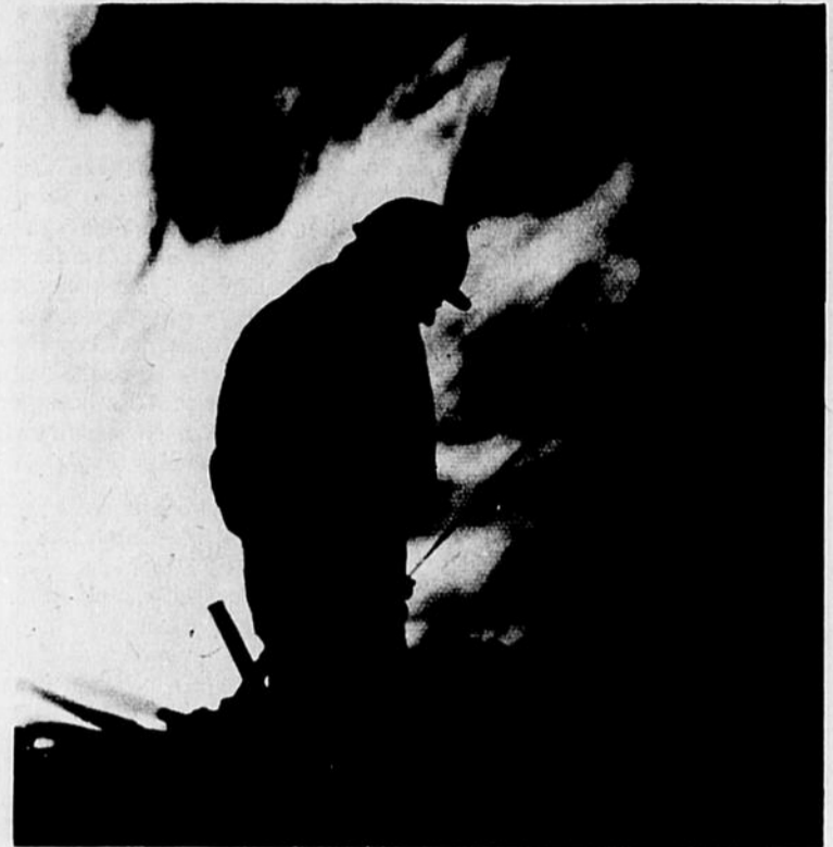
Essai de production lors du forage par Soqip d'un puits à St-Flavien.

Le Québec est largement dépendant de l'Alberta pour son approvisionnement en carburant. En viendrons-nous, en cette province à payer le gallon d'essence $2.00 comme en Europe. Beaucoup de compagnies pétrolières se livrent à des recherches intensives sur tout le territoire québécois dans l'espoir d'y découvrir ces fabuleuses nappes d'huile qui changent le sort économique des heureux états qui en trouvent. Jusqu'ici, hélas, ces recherches coûteuses n'ont rien donné.