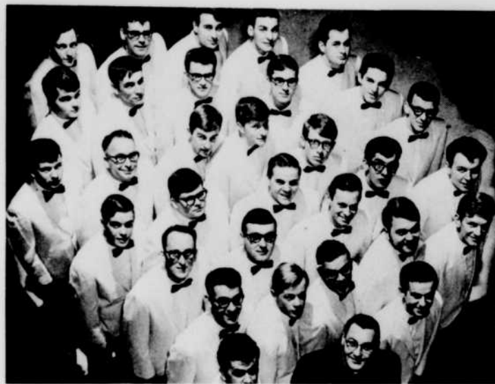
Chorale de l'université de Moncton

L'Acadie garde vivant son visage français, grâce à la présence des nombreuses chorales des institutions franco-canadiennes. Chaque année, plusieurs festivals décernent des prix aux ensembles jugés les meilleurs, dont la réputation s'étend jusqu'en Europe.