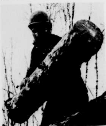
«Les Bûcherons de la Manouane», film d'Arthur Lamothe à l'affiche de «Canadiana», mardi matin à 11 h.