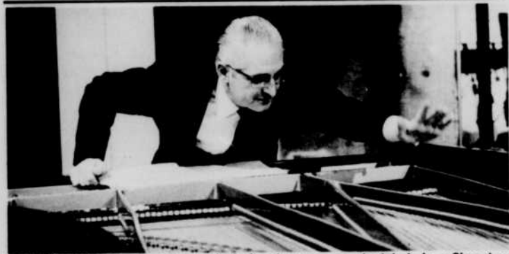
CHARLES REINER , pianiste et chef d'orchestre, sera invité à la «Chronique du disque», à la radio, samedi à 10 heures du matin.