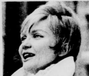
MARGO MACKINNON chantera à «Mon pays, mes chansons», samedi à 9 heures du soir, à la télévision.