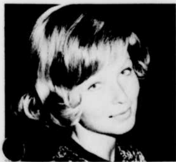
MARINA VLADY que l'on verra dans "Crime et châtement", vendredi à 11 h 35 du soir.