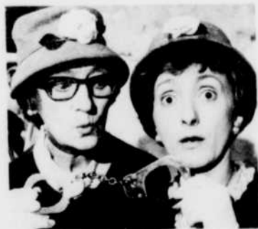
BERTHE ET BLANCHE vivent des aventures aussi hilarantes que palpitantes, chaque jeudi à 10 h 30.