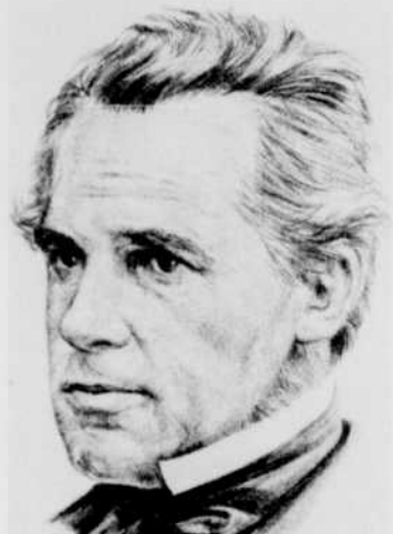
Sir Georges-Etienne Cartier

Le Bas-Canada est désormais distancé par le Haut-Canada. Il a perdu sa supériorité numérique. En vingt ans, la population Haut-Canada triplera, grâce à l'arrivée d'immigrants anglais. Pendant la même période, le Bas-Canada est victime d'une saignée massive de population en faveur