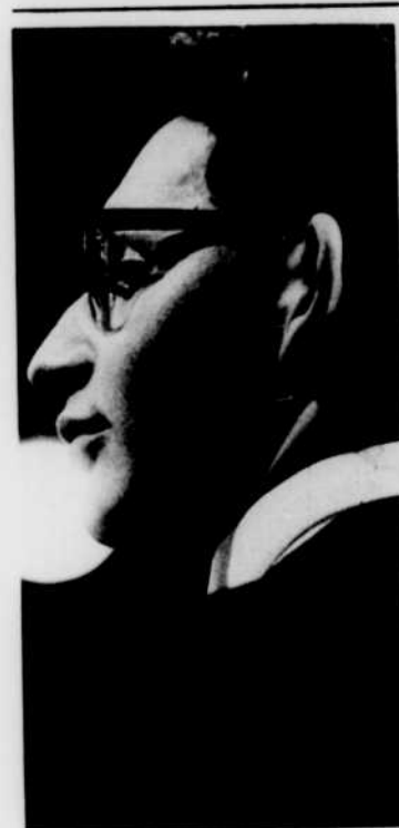
BORIS BROTT dirige l'orchestre de «Classiques à la mod», chaque dimanche soir à 6 h. 30.