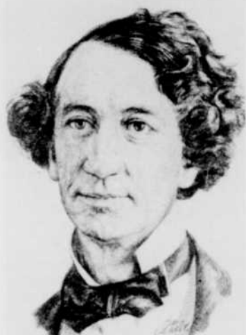
Sir John A. MacDonalld

On étudiera la coalition conservatrice dirigée par John A. MacDonalld et Georges-Etienne Cartier, à l'émission les Grandes Heures du Canada , le samedi 12 août à midi, à la radio de Radio-Canada.