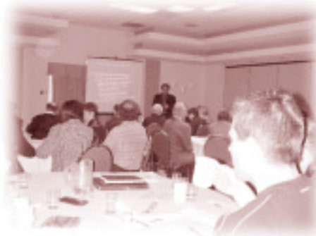
Vue d'une partie des participants à la journée de formation du 20 mars à Lévis

et valeurs de référence. On a aussi présenté et discuté de cas concrets, proposé une démarche et des outils à employer. Il a également été question du problème particulier des moisissures et de l'information à transmettre aux milieux de travail sur la QEI.