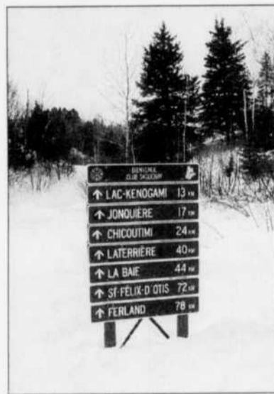
Les sentiers du Club Saguenay seront prêts pour l'ouverture de la saison.

La rencontre d'ouverture du Club Saguenay, se tiendra exceptionnellement à la Polyvalente d'Arvida, le samedi 17 novembre. Par les années passées, le Club Saguenay tenait cet événement à la polyvalente de Jonquière. Les membres sont donc conviés au 2215 boulevard Melon pour cette rencontre d'ouverture.