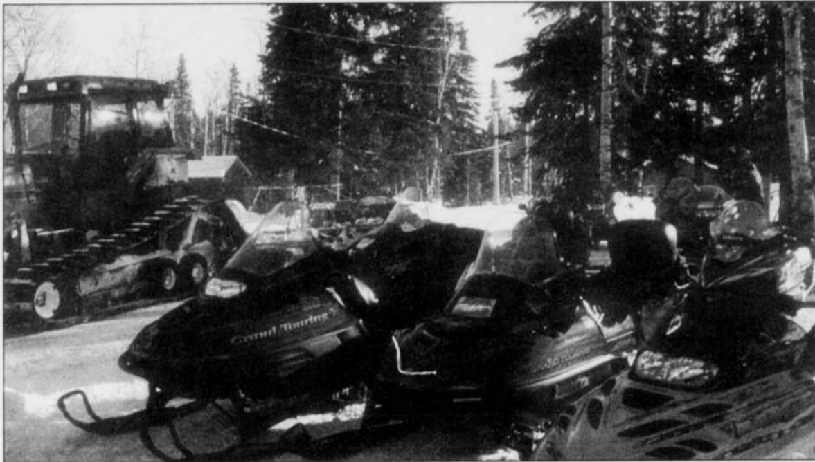
TOURISME - La motoneige s'impose comme des principaux générateurs de l'industrie touristique d'hiver. Des milliers de visiteurs étrangers visitent notre région grâce aux attraits de la motoneige.

En effet, le Saguenay-Lac-Saint-Jean a su tirer profit des retombées touristiques de