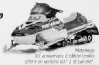
Motoneige 80 e anniversaire d'édition limitée offerte en versions MX* Z et Summit*