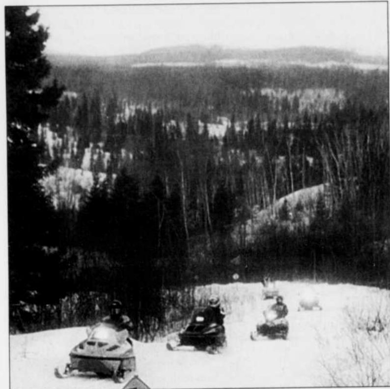
MONT-VALIN - Le nouveau club fusionné Caribou-Conscrits, veut développer les Monts-Valin et rendre ce coin de pays encore plus accessible.

Le phénomène des fusions au Saguenay n'a pas épargné le monde de la motoneige. Récemment, le club de motoneigistes Caribou et le Club des Conscrits ont uni leurs forces afin d'offrir de meilleurs services à leurs membres.