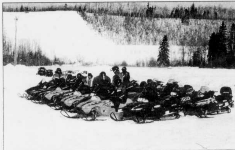
RANDONNEE - Les randonnées en groupe gagnent en popularité. Les locuteurs de motoneige en organisent plusieurs par saison avec la collaboration des officiers bénévoles de sécurité.

Beaucoup d'améliorations sur les modèles de série proviennent du monde de la course et 2002 n'a pas fait exception chez Arctic Cat. Les modèles étaient très bien calibrés, malgré la température chaude, très chaude... Presque 15 degrés! Une des nouveautés intéressantes se situe au niveau de la suspension: