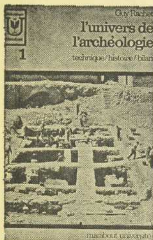
L'UNIVERS DE L'ARCHEOLOGIE par Guy Rachet Marabout Université