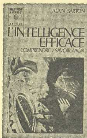
L'INTELLIGENCE EFFICACE par Alain Sarton Marabout Service