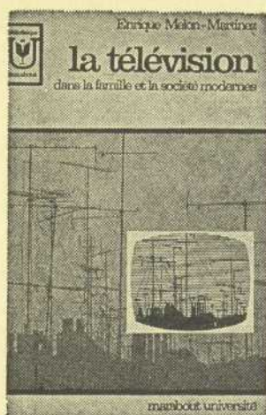
LA TELEVISION par E. Melon-Martínez Marabout Université