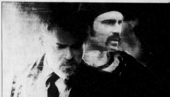
Les yeux exorbités de Ray Liotta et la mine patibulaire de Jason Patric suffisent amplement à donner au film Narc l'énergie nécessaire pour se laisser happer sans résistance.

Nettement plus violent et pervers que l'épisode le plus sulfureux d'une télésérie policière, Narc en affiche souvent les contours rassurants, les artifices familiers, les clichés d'usage: rarement sait-on où se camoufflent le Bien et le Mal, la vérité et le mensonge. Même si le public semble moins à la recherche d'un nouveau Tarantino que certaines stars d'Hollywood, peu importe que Narc réussisse à séduire les foules, l'avenir (immédiat) de Joe Carnahan apparaît assuré. Un confort dont il devrait se méfier.