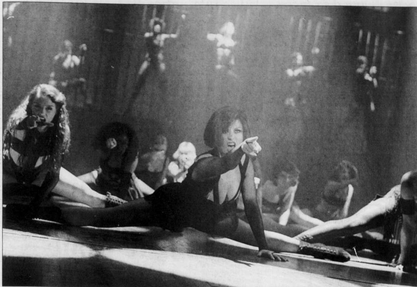
Catherine Zeta-Jones est étonnante dans le rôle de Velma Kelly, une star du cabaret emprisonnée pour double meurtre.