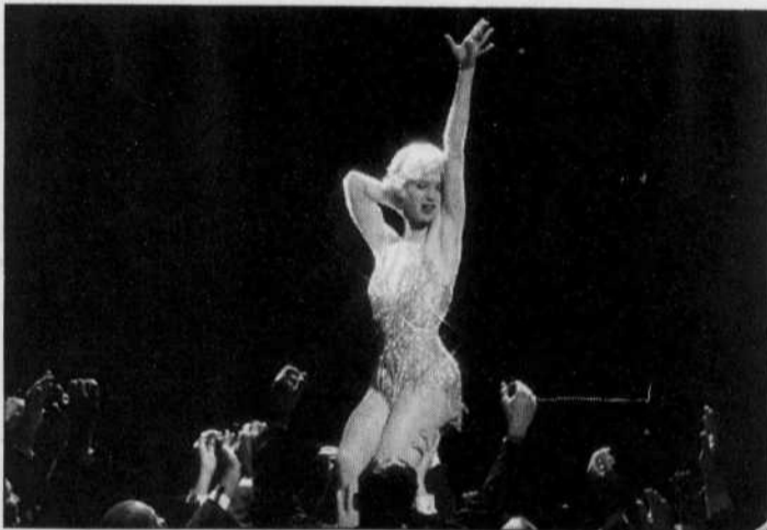
Le personnage de Roxie Hart, interprété par l'excellente Renée Zellweger, rêve de connaître la gloire dans les cabarets du red light et va son chemin de lit en lit.

monde réel dans lequel sa pellicule se déverse en vestiges des bombardements du show-business. Que ce soit dans le scénario admirablement construit, dans le montage halluciné, dans l'élan infatigable de la mise en scène aux ostentations mesurées, dans l'interprétation de haut vol (Zellweger, Zeta-Jones et Reilly en tête), le tout conspire à faire de ce Chicago inattendu un moment charnière dans l'histoire du cinéma musical.