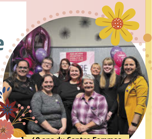
40 ans du Centre Femmes