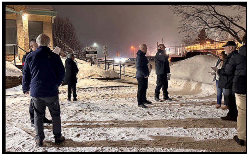
Les citoyens qui prévoyaient assister à la séance du conseil municipal de Saint-Antoine-de-Tilly le 17 février dernier se sont butés à une porte close.

Ceux qui s'étaient déplacés pour assister à la séance se sont dits, pour la plupart, déçus de la façon dont l'annonce a été faite. Cette déception s'explique pour certains par le fait qu'ils faisaient confiance à l'équipe en place. Ils auraient aimé que le maire démissionnaire se présente devant les citoyens et leur explique sa décision.