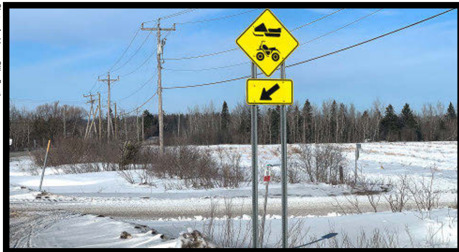
Les clubs de motoneigistes auront accès à une aide financière pour l'entretien des sentiers.

Les clubs de motoneigistes de la Chaudière-Appalaches profiteront d'une aide financière de 558 000 $ pour les soutenir dans l'entretien des sentiers.