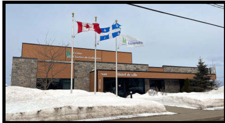
Lotbinière recevra une aide financière dans le cadre du programme d'aide à la voirie locale.

Le ministère des Transports et de la Mobilité durable a confirmé, le 13 janvier, une aide financière de 9,5 M$ à quatre municipalités de la circonscription de Lotbinière-Frontenac. Cet argent est octroyé par l'entremise du programme d'aide à la voirie locale (PAVL).