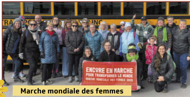
Marche mondiale des femmes

Pour en savoir plus, visitez le cflotbiniere.org