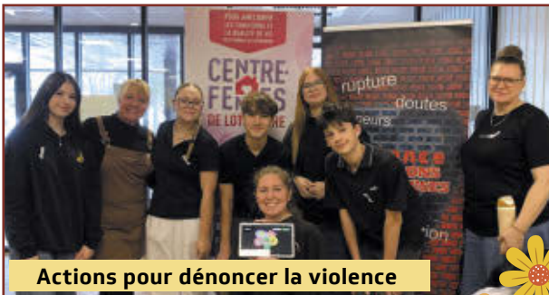
Actions pour dénoncer la violence