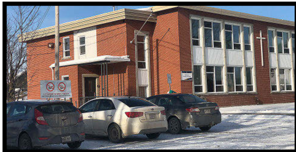
La MRC de Lotbinière abandonne l'idée de la taxe à l'immatriculation.

Depuis l'automne, le service de transport collectif Express Lotbinière a été bonifié avec l'ajout de lignes qui relient les municipalités de Saint-Apollinaire, Saint-Agapit, Saint-Gilles, Laurier-Station, Sainte-Croix, Saint-Antoine-de-Tilly et Issoudun ainsi que Québec et Lévis. C'est une contribution de 250 000 $ de la Fondation du Cégep de