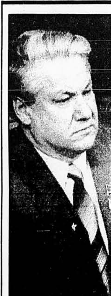
Boris Eltsine

Une vague d'attentats et d'incendies criminels a suivi depuis le 2 novembre la décision du CEP d'écarter de la course à la présidence douze personnalités, dont plusieurs anciens ministres de la période Duvalier en application de la nouvelle Constitution, massivement approuvée le 29 mars dernier.