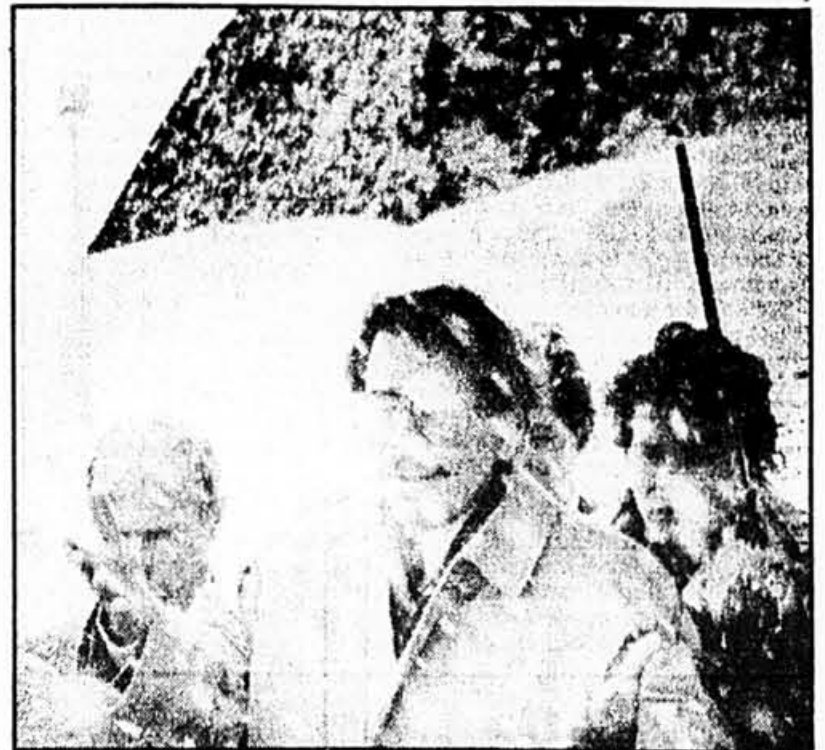
C'est sous une neige abondante que Daniel Ortega a quitté le siège de l'OEA, après son allocution.

Dans des déclarations au New York Times, M. Ortega s'était déclaré prêt à rencontrer le président Reagan, même en présence de dirigeants des contras.