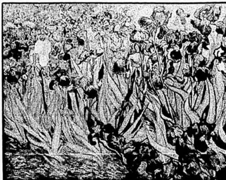
Les Iris , a été exécuté en 1889, un an avant la mort du peintre. Van Gogh était alors interné à l'asile.

Les spécialistes de Sotheby's avaient estimé, avant la vente, que l'oeuvre serait cédée pour un prix variant entre $20 à $39 millions, tout en estimant que ce prix pourrait augmenter, compte tenu de la faiblesse relative du dollar américain, ce temps-ci, sur les marchés internationaux.