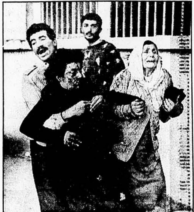
Des témoins horrifiés ont aidé les blessés, après l'explosion de Beyrouth.