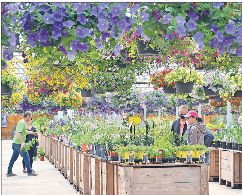
Le spectacle coloré qu'offrent les serres de la région en cette période de l'année est des plus magnifiques.