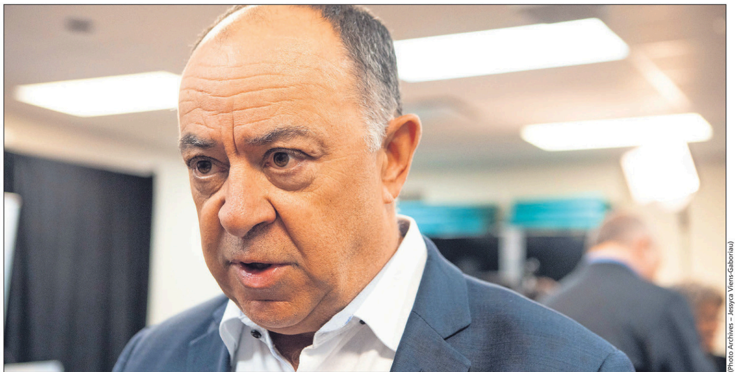
Le président du Conseil du trésor, Christian Dubé, souligne que des 2,9 G$ d'investissements devancés pour l'année financière en cours, 421 M$ sont prévus en Montérégie et 14 M$ pour le Haut-Richelieu.

À ce montant prévu pour la région peuvent s'ajouter des enveloppes globales. Par exemple, le Haut-Richelieu pourrait bénéficier du programme d'achats d'iPad de 700 000 $ pour les élèves ou encore profiter des 66 M$ ajoutés pour les maisons des