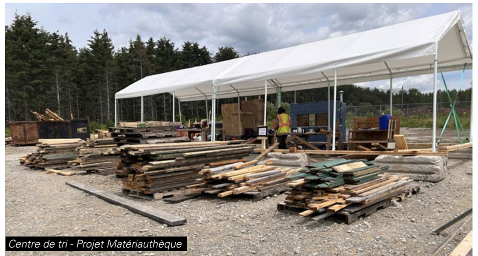
Centre de tri - Projet Matériauthèque

Le bois peut être utilisé à plusieurs projets de construction et de bricolage divers. Il s'agit d'une façon ingénieuse de réduire l'impact environnemental d'un projet en misant sur la réutilisation de matières résiduelles.