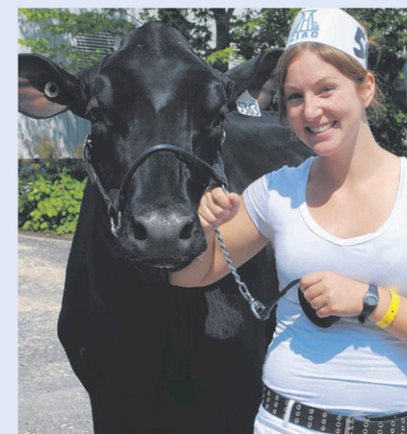
Les participants aux jugements d'animaux sont toujours présents en grand nombre à l'Expo Vallée de la Coaticook.

Le lendemain (7 août), place à la jeunesse. Les organisateurs de l'Expo Vallée accueilleront des centaines de jeunes des Services d'animation estivale.