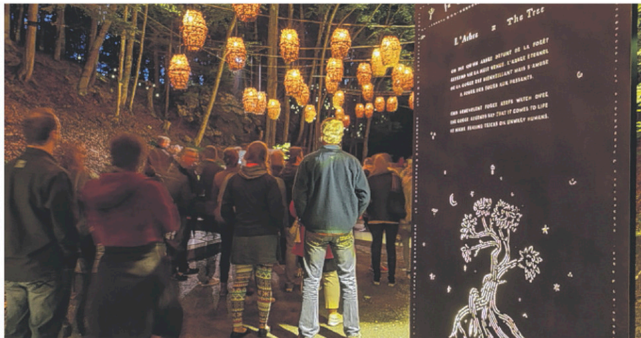
Foresta Lumina attire des visiteurs de l'étranger.

Andorre est en effet une destination touristique prisée par les amateurs de sports d'hiver,