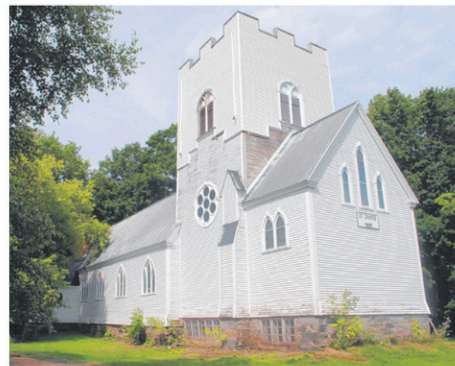
L'église St.James de Compton, construite en 1887, a connu quelques épisodes de travaux au cours des dernières années, via le Fonds d'urgence du patrimoine religieux de la MRC de Coaticook.

Que compte faire M. Jubinville avec sa nouvelle acquisition? «En ce moment, je n'ai pas un projet particulier en tête. Je compte faire appel à un professionnel pour faire une inspection du bâtiment et m'aider à prendre une décision.»