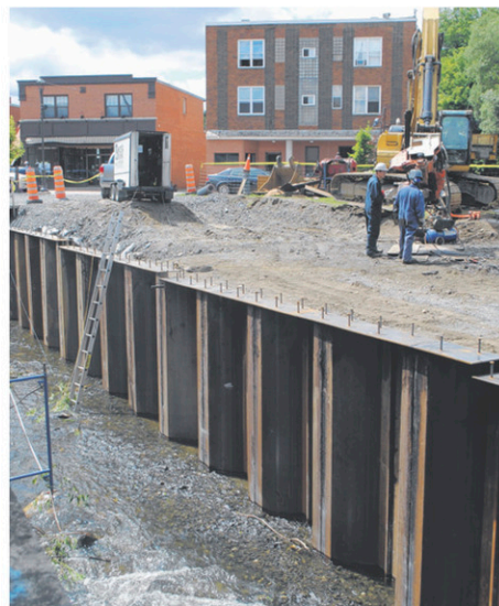
Les équipements lourds sont au centre-ville de Coaticook depuis quelques semaines pour les travaux correctifs du ruisseau Pratt.

La Ville de Coaticook estime le coût des travaux à quelque 925 000 $, une somme qui sera partagée entre la Municipalité et sept propriétaires riverains.