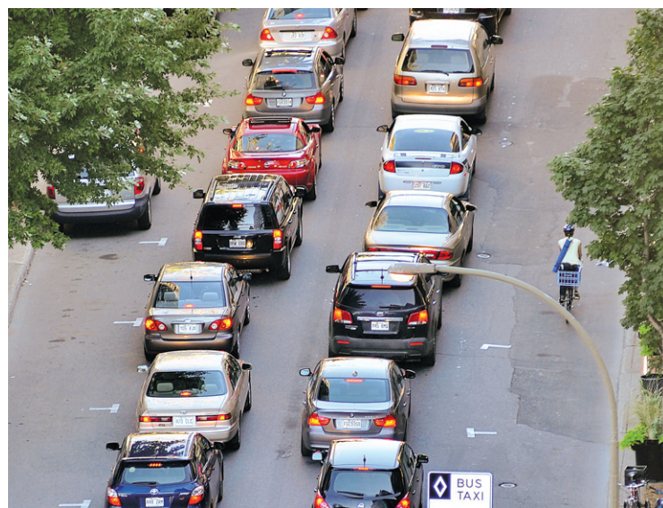
OLIVIER ZUIDA LE DEVOIR

Les rues transversales de la petite section fermée de la rue Sainte-Catherine demeureront ouvertes toute la journée.