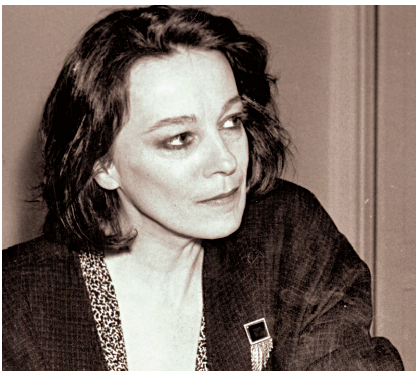
Sa voix rauque, sa diction remarquable et sa grande intelligence des rôles rendaient Marthe Turgeon inoubliable. On la voit ici en 1987.

En 2004, elle a participé à un atelier d'écriture au Centre d'écriture scénique de Montréal. Elle a également œuvré à titre de professeure pendant plusieurs années. Marthe Turgeon a joué dans plus d'une centaine de premiers rôles depuis 1972: