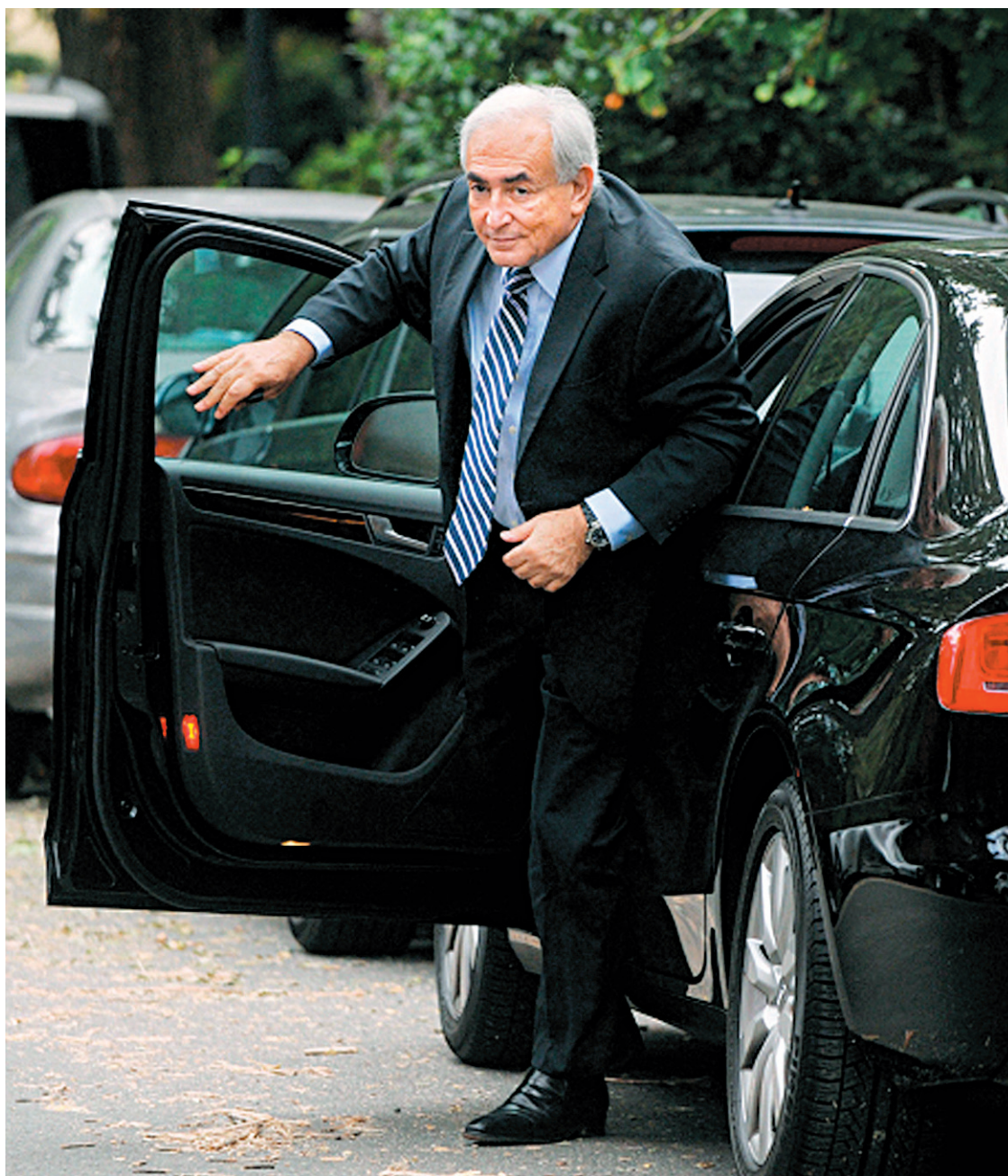
Dominique Strauss-Kahn est passé par Washington, en début de semaine, pour visiter ses anciens employés du FMI.

Ceci ne veut pas dire que les inégalités entre les hommes et les femmes sont réglées... loin de là. Mais il s'agit de prendre la mesure de ce changement qui marque les modus operandi nord-américains en matière de violence sexuelle, même si ceux qui régissent encore la plupart des