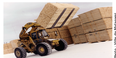
Élévateur à fourche, Produits forestiers Domtar inc. Matagami.

Monsieur Sam Hamad, ministre des Ressources naturelles, de la Faune et des Parcs, se dit favorable à l'idée de parvenir à un accord équitable et à long terme avec les États-Unis afin d'éviter l'émergence d'autres conflits dans le dossier du bois d'oeuvre résineux. Il reste à voir si