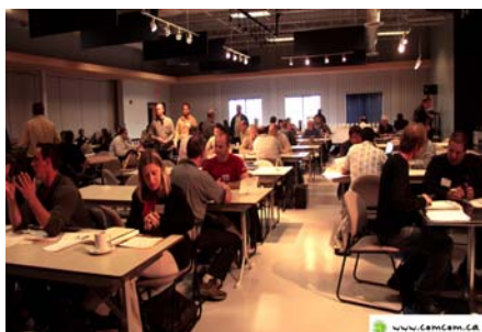
Aperçu des participants de la salle lors de l'activité de maillage.

C'est plus de 75 représentants d'entreprises qui ont participé à la troisième activité de maillage au chantier de l'Eastmain-1 qui a eu lieu le 12 septembre 2004. Parmi ceux-ci, 15 provenaient de la région Nord-du-Québec, 25 de l'Abitibi-Témiscamingue et 35 du chantier Eastmain-1.