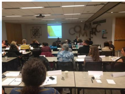
Les participants prennent un avant-goût du prochain RDA Toolkit