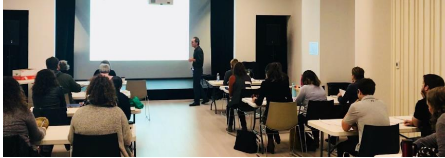
Présentation de la norme de catalogage RDA à Drummondville