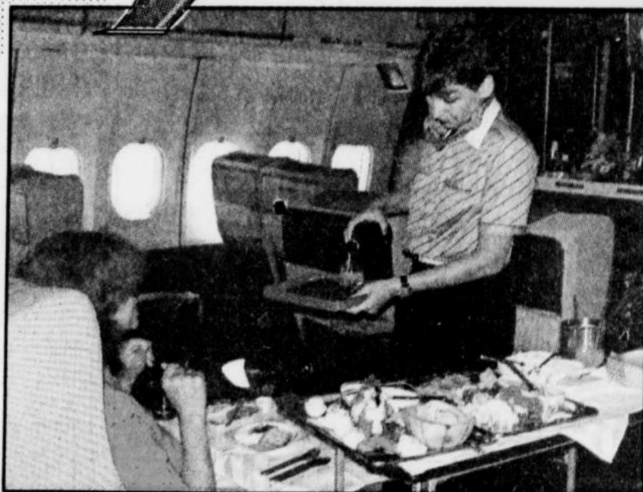
Le Soleil, Claude Vaillancourt