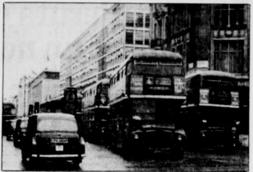
Le « marasme » actuel, en Grande-Bretagne, est le résultat de la guerre des tarifs sans merci que se livrent les grands voyagistes pour garder leur part de marché.

Si comme on s'y attend, les concurrents de Thomson, Intasun par exemple, prennent des mesures similaires, ce sont plus d'un million de voyages qui pourraient avoir disparu des brochures l'an prochain. En redonnant la priorité à la qualité sur la quantité, l'industrie espère bien sûr redorer son blason, mais surtout ne plus vendre à perte au dernier moment.