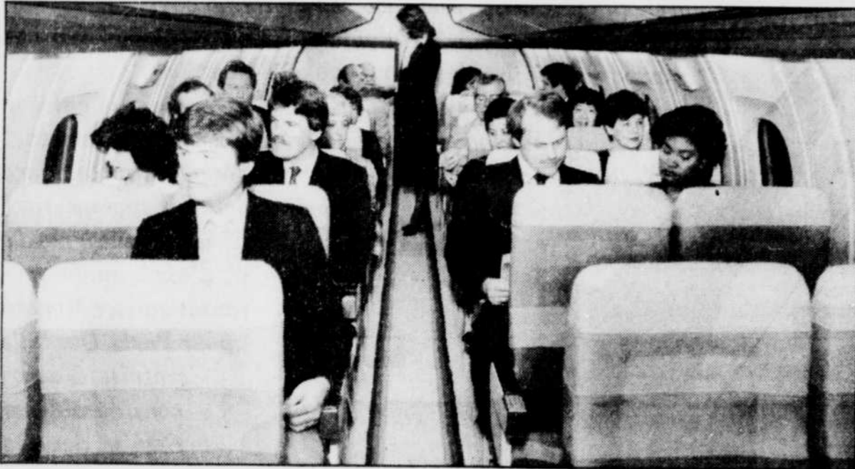
Les sièges du Dash 8 sont confortables et bien répartis.