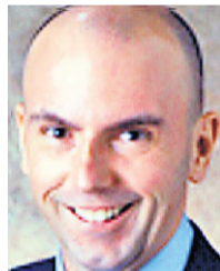
L'auteur est conseiller principal au groupe Capital Hill.

Après avoir entendu les explications de l'ancien PDG de la Caisse de dépôt et de la ministre des Finances, il est temps de mettre fin à la chasse aux sorcières. Contrairement à la série télévisée CSI , on ne pourra, à force de déduction et d'équipement sophistiqué, trouver celui qui a commis le crime. Personne à la Caisse ou au gouvernement du Québec n'avait comme objectif un rendement négatif et encore moins de cette ampleur. Il n'y aura pas d'empreintes digitales sur l'arme du crime, car il n'y a pas de crime.