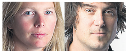
TEXTES: SOPHIE ALLARD

Qu'est-ce qui pousse un jeune de 12 ans à consommer de la drogue ou de l'alcool? À quoi ressemble le mal qu'il veut anesthésier? Quels sont les mots qu'il trouvera pour nommer cette douleur dont il veut se délivrer? Au Grand chemin, on trouve ces réponses.